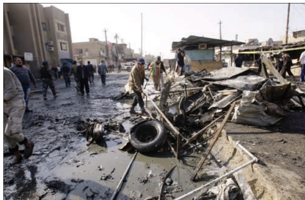
أثار التفجير الانتحاري الذي استهدف حي الزعفرانية في بغداد أمس (أ.ب.ب)

وقالت كلينتون أن الولايات المتحدة ستقوم بكل ما يمكنها للمساعدة (لكن العراق في نهاية الامر دولة ديمقراطية الآن لكن عليه أن يتصرف كدولة ديمقراطية وهذا يتطلب حلولًا وسطًا».