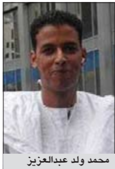
محمد ولد عبدالعزيز

نواكشوط - العربية.نت: في تطور مفاجئ أفرجت السلطات الموريتانية عن نجل الرئيس محمد ولد عبدالعزيز الذي أطلق النار على فتاة وأصابها إصابة خطيرة في صدرها، وأحالت مفوضية الشرطة في العاصمة المتهم ورفاقه إلى النيابة العامة التي أخلت سيبلهم بعد تنازل والد الضحية عن التوكوي.