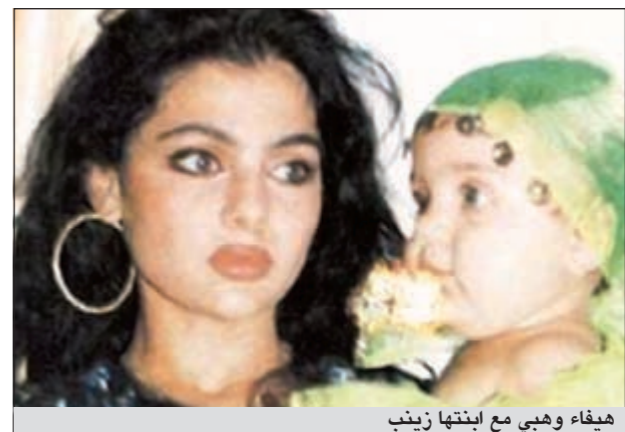
هيفاء وهبي مع ابنتها زينب

لطالما احتلت الأمومة حيزاً مهماً في حياة الفنانة هيفاء وهبي التي شغلت الناس منذ إطلالتها الفنية بجوانب من حياتها الشخصية، ومنها قصتها مع ابنتها زينب التي عاشت منذ طفولتها بعيداً عنها، في كنف والدها وعائلة جدتها. وقد كسبت هيفاء تعاطف الجمهور معها، لجهة انفصالها القسري عن زينب بسبب ظروف عائلية، فرضت البعد الجغرافي والعاطفي بين الأم وابنتها التي نشأت بعيداً عن الأضواء.