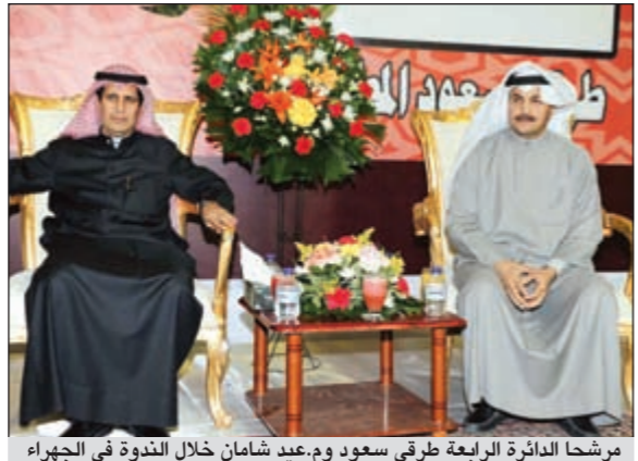
مرشحا الدائرة الرابعة طرفي سعود وم.عبد شامان خلال الندوة في الجهراء