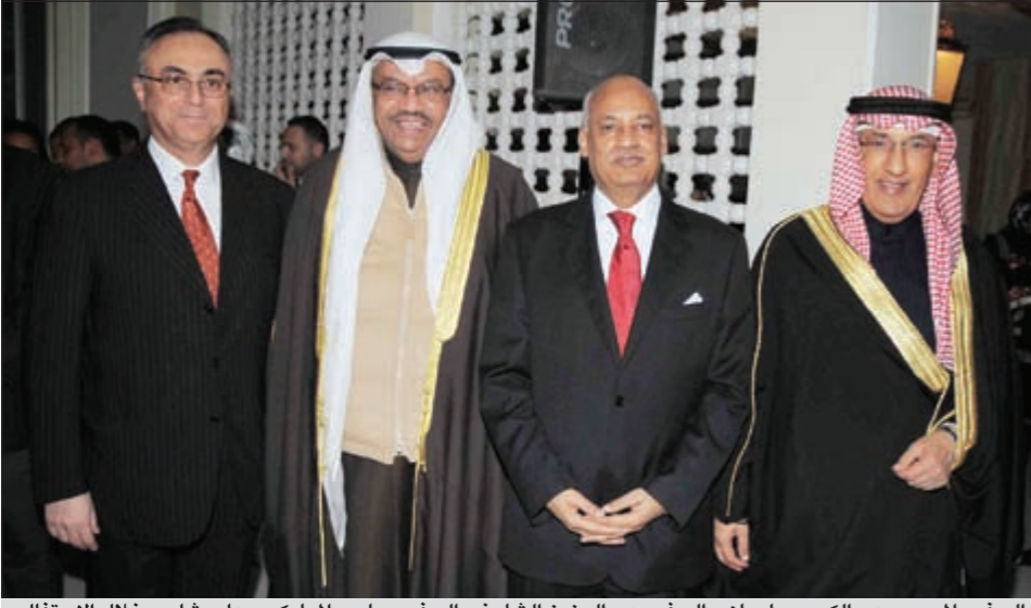
السفير المصري عبدالكريم سليمان والسفير عبدالعزيز الشارخ والسفير جاسم المبارك وعلي شلبي خلال الاحتفال

في أول عيد لثورة 25 يناير حق للمصريين ان يحتفلوا بإسقاط انشع نظام قمعي وأن لهم أن يفرحوا بعد عام كامل من ثورة شهد لها العالم أجمع بانها من أرقى ثورات التاريخ وسيدرسها العالم في كتيبه كصفحة بيضاء لثورة بيضاء ألهمت شعوب المنطقة والعالم للتغيير والثورة على الظلم والفساد والاستبداد. وفي الكويت أقام السفير المصري لدى البلاد عبدالكريم سليمان حفلا بهذه المناسبة بدار السفارة بالدعية مساء امس الاول شارك فيه العشرات من أبناء الجالية والديبلوماسيين في لفحة كريمة، حيث تذكر الجميع بالعرفان دور شهادة مصر الأبرار في هذه الثورة ودعوا لمصابيها بالشقاء العاجل.