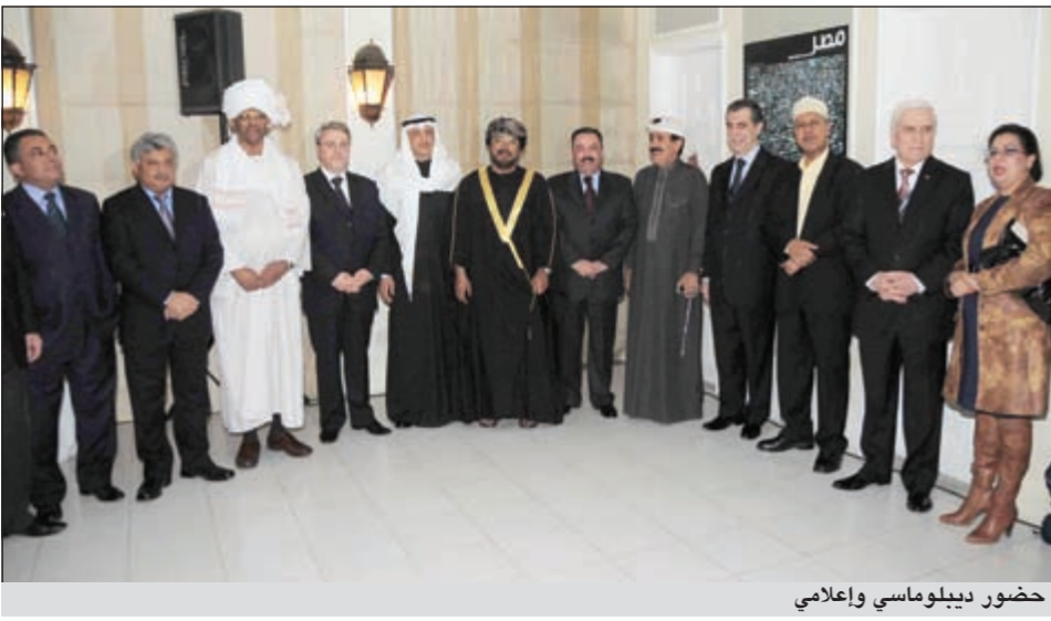
حضور ديبلوماسي وإعلامي

بمصر الى أعلى مصاف الدول، وهو طموح مستحق. وأكد أن قوة مصر ونهضتها ليست فقط لأبنائها، فمصر هي أيضا مصر العرب، التي قال فيها الشاعر: «أنا إن قتر الإله ماتي.. لا ترى الشرق يرفع الرأس بعدي» فمصر كانت ومازالت وستظل الحاضنة والشقيقة الكبرى والقلب النابض والداعم لكل العرب، فكما أن قوة العرب هي قوة مصر فإن عز مصر وقوتها هو عز لكل العرب، وأمن مصر هو أمن كل العرب، فمصر كنانة الله في أرضه، ستظل قوية رائدة، وستبقى واحة للأمن والأمان الى يوم الدين. وفي ختام كلمته قال سليمان: أقدم وملايين المصريين تحية إعزاز وتقدير لشهداء ثورة 25 يناير من خيررة وزهرة شبابنا الذين ضحوا بدمائهم في سبيل نهضة بلدهم، منتظعا ان يكون العام الجديد في عمر الثورة استكمالا لعملية التحول السلمي الديموقراطي، وتعافيا للاقتصاد المصري، وازدهارا لمصرنا الحبيبة في شتى المجالات، واختتم حديثه إليكم بالتذكير بابيات للشاعر التونسي الكبير أبو القاسم الشابي: