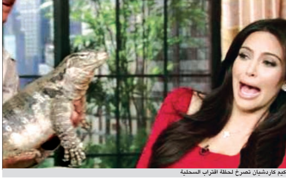
كيم كاردشيان تصرخ لحظة اقتراب السحلية

خاضت نجمة تلفزيون الواقع الأميركية كيم كاردشيان تجربة لا تحسد عليها خلال مشاركتها في تقديم حلقة جديدة من برنامج «live with kelly» حيث كان يتواجد في الاستوديو سحلية ونمر صغير مع بيتر غروس خبير الحيوانات البرية. وكان بيتر غروس خبير الحيوانات البرية يعرف كيم كاردشيان على الحيوانات، وهو الأمر الذي دفع كيم كاردشيان للخوف والذعر أمام المشاهدين. وبعد انتهاء الحلقة كتبت كيم كاردشيان على صفحتها الخاصة «علي «تويت»: «النمر الرضيع كان لطيفا جدا، لكن لا أستطيع القول الشيء نفسه بالنسبة للسحلية، فكانت تحاول شم راحتي وتخرج لسانها».