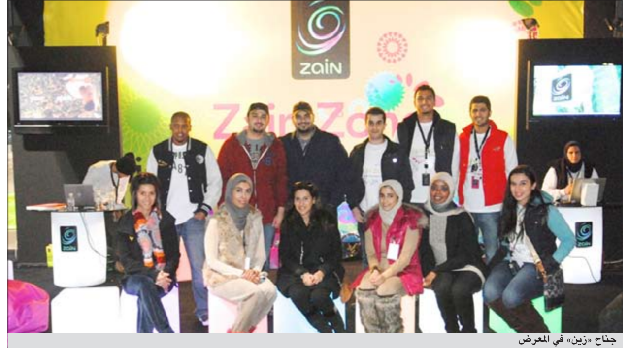
جناح «زين» في المعرض

أعلنت «زين» أكبر شبكة اتصالات في الكويت أنها رعت ملتقى المدونين الذي احتضنته مؤخرا الكلية الأسترالية، والذي شهد مشاركة واسعة من المدونين والعديد من الطلاب والحركات الشبابية. وذكرت الشركة ان رعايتها لليوم المفتوح الذي شهد هذا التجمع الكبير للمدونين وجاء من منطلق حرصها على توطيد علاقتها بجميع الجهات والمؤسسات، وهي الرسالة الاجتماعية التي دائما ما تحمّلها جميع مبادراتها وبرامجها.