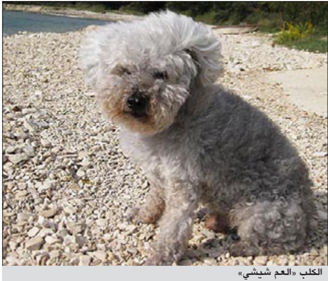
الكلب «العم شيشي»

وقالا ان صحة الكلب تتدهور منذ أكثر من عقد ولكنه كان يعالج وتمكن من حضور زفافهما في كرواتيا في أكتوبر 2010 إلا انها أسفا لأنه بعد إصابة الكلب