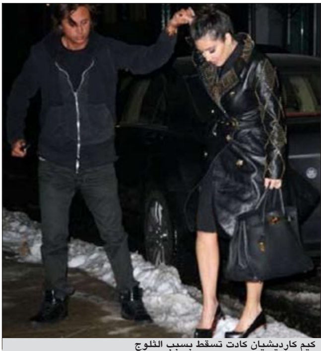
كيم كارديشيان كادت تسقط بسبب الثلوج

على الرغم من برودة الطقس إلا أن النجمة كيم كارديشيان ارتدت ملابس قصيرة مع معطف جلدي طويل، وكادت تسقط بسبب ارتدائها الكعب العالي من كريستيان لوبوتان. وشوهدت كيم كارديشيان تتوجه إلى احد المطاعم في نيويورك مع صديقها المفضل جوناثان شيبان، الذي كان يمسك بيدها ويحاول أن يساعدها في السير وسط الثلوج. وعلى الرغم من أن كيم كارديشيان كانت تمتنع العام الماضي بشهرة كبيرة ومحبه أكبر إلا أنها سرعان ما تبديلت بعد طلاقها من زوجها بعد فترة قصيرة، وبدأت حملات الهجوم تواجهها باعتبارها مهندسة وتفسد الثقافة الأميركية.