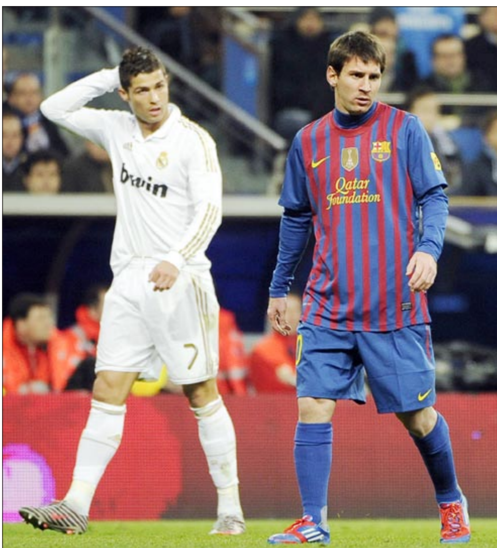
الصراع يتجدد بين ليونيل ميسي وكريستيانو رونالدو

برشلونة رد بقسوة وحقق الفوز في كل منهما. ومارت مباريات الكلاسيكو السبع التي شهدتها عام 2011 في مختلف البطولات حاضرة في الأذهان، وهو ما أثار بعض الجدل بشأن إمكانية تراجع جاذبية الكلاسيكو في قلوب المشجعين وفي اهتمامات وسائل الإعلام، خاصة أن العام الحالي قد يشهد ثمانية مباريات كلاسيكو، وسبق لإيكر كاسياس حارس مرمرى ريال مدريد أن أكد أن لقاءات الكلاسيكو قد تفقد قيمتها وأهميتها بالترار، مشيراً إلى أن متعتها قد تتراجع بينما يتزايد الجهد المبذول فيها. وقدم كاسياس أداء رائعاً في كلاسيكو الأربعاء الماضي، حيث أنقذ فريقه من عدة أهداف محققة ولعب دوراً كبيراً في خروج الريال متقدماً 1 - 0 في الشوط الأول قبل أن ينتج برشلونة بعناده وأسلوبه في التصريح المتقن والاستحواد على الكرة في إجهاد الريال خلال الشوط الثاني الذي سجل فيه هدفين رائعين. ومن المؤكد أن هذا العناد من برشلونة ونجاحه في التغلب مجدداً على أسطورة المدرب البرتغالي جوزيه مورينو المدير الفني للريال أضاف مزيداً من البريق على لقاءات الكلاسيكو انتظاراً لما تستقر عنه مباراة اليوم.