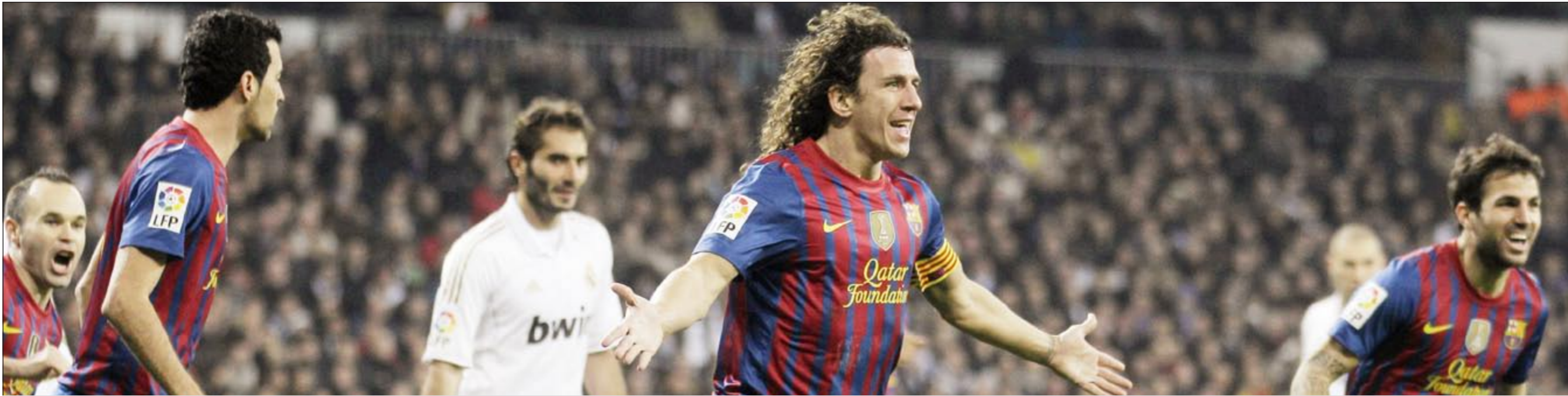
فرحة قائد برشلونة كارليس بويول بهدف الفوز لفرقة في مرمرى ريال مدريد في ذهاب ربع نهائي الكأس

مورينو يحتاج إلى معجزة للتأهل لنصف نهائي كأس الملك ويتسلح بالهجوم في رحلة الدفاع عن لقبه واستعادة الهيبة المفقودة