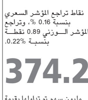
374.2 مليون سهم تم تداولها بقيمة 36.4 مليون دينار.