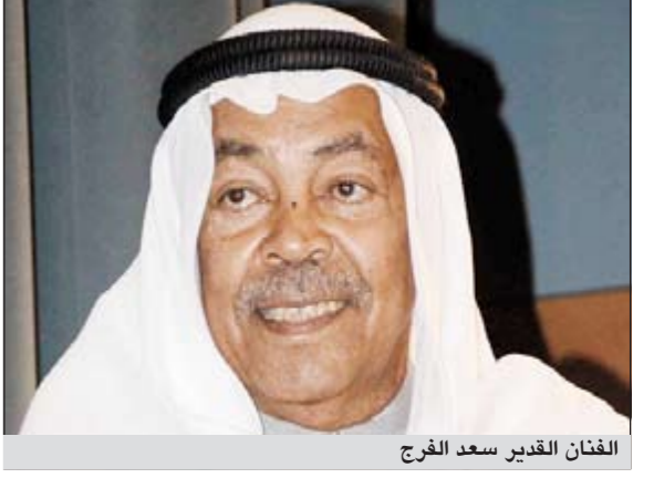
الفنان القدير سعد الفرج

وجه الفنان القدير سعد الفرج الدعوة للجمهور المتابعة عروض المسرحية السياسية «عبر و11 سبتمبر» التي ستنتقل عروضها على صالة مسرح الدسمه السبت المقبل، مشيرا في تصريح خاص الى ان المسرحية تمثل استعادة متميزة للمسرح السياسي الذي غاب طويلا عن المسارح العربية بشكل عام والخليجية بشكل خاص. مؤكدا بان العرض سيشكل مفاجأة حقيقية واطافة متجددة للمسرح السياسي الاجتماعي الساخر.