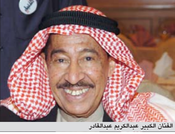
الفنان الكبير عبد الكريم عبدالقادر