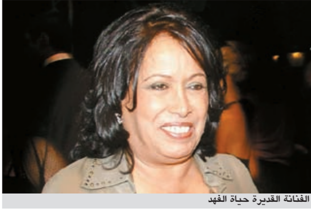
الفنانة القديرة حياة الفهد

جدا، لان الاخرى التي يظهرن مثل «الدمى» على الشاشة ليظهرن وجوها بلا تعبير، تغرق في المكياج، وتشبه كل واحدة الاخرى، المصيبة ان المخرج احيانا يقرب العدسة من وجوه «الدمى» باحفا عن تعبير ما.. فلا يظهر بسبب الحزن التي تجمد ملامح الممثلة وطبقة المكياج الثقيلة، فيظهر الوجه مقرزا للمشاهد المسكين». وابدت «سيدة الشاشة الخليجية» تفهمها لتعاون بعض المخرجين مع هذه النوعية لقللة الممثلات الخليجيات، وقالت: لا اري انه يجب ان اسمي ممثلة بعينها ترى فيها امتدادا لها، لانها لا تؤمن بوجود امتداد للفنان، بل لكل فنان حقيقي شخصية، وتركت ذلك للجمهور الذي يستطيع ان يلتقط ملامح الشبه في الاداء او الشكل او الخط الفني للوجود الشاب مع الفنان المخضرم.