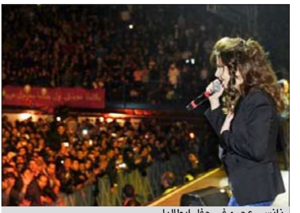
نانسي عجرم في حفل ايطاليا

اشعلت النجمة اللبنانية نانسي عجرم حماس المعجبين في حفلها الاول في مدينة ميلانو في ايطاليا. وجاء الاحتفال ضمن أنشطة اسبوع الموازة العالمي الذي تالقت فيه نانسي حضورا وغناء، وحضره اكثر من 8 آلاف شخص من جنسيات عربية واجنبية مختلفة. صفقوا ورقصوا مع الفنانة اللبنانية لمدة ساعتين.