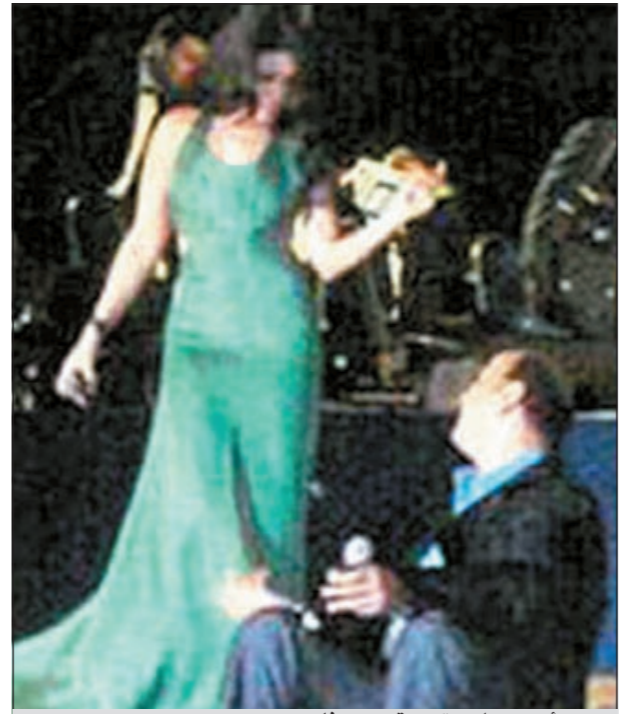
عمرو اديب يجلس تحت قدمي هيفاء

لا يبدو أن الإعلامي المصري عمرو أديب يحظى بإعجاب أو محبة في المغرب العربي الذي شن هجوما عنيفا عليه، معتبرا أنه يتدخل في شؤون البلد الداخلية بينما كان من الأجدى به أن ينصرف إلى أمور بلده بعد الثورة، وجاء ذلك بحسب ما ذكر موقع «أنا زهرة»، على خلفية تعليق عمرو أديب على الفيديو الذي انتشر عبر «يوتيوب» وهو مأخوذ من القناة المغربية. ويظهر الفيديو ولي عهد المغرب الأمير الحسن الذي لم يتجاوز الثامنة، يفتح حديقة حيوانات في المغرب، بينما كبار المسؤولين في الدولة يقبلون يده، وأبدى عمرو أديب استغرابه من ذلك، لكنه لم ينتقد أو يهاجم الشعب المغربي، بل قال إن تقبيل يد الأسرة الحاكمة في المغرب يعتبر من عادات البلد وتقاليده، لكنه أبدى انزعاجه ضمن برنامجه «القاهرة اليوم» من قيام شخصيات كبيرة بذلك، فما كان من الصحافة المغربية إلا ان وصفت المذيع بذلك بـ «البلطجي».