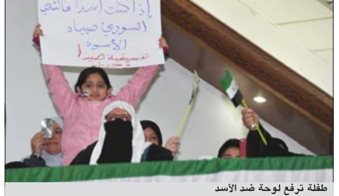
طفلة ترفع لوحة ضد الأسد