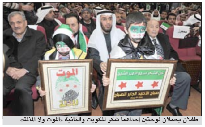
طفلاً يحملان لوحتين إحداهما شكر للكويت والثانية «الموت ولا الخلة»

ووجه الدقباسي عدداً من الرسائل السريعة أو لاهلها للجامعة العربية قائلاً «ألا تخفي 9 أشهر من القتل والدماء وهتك الأعراض لاتخاذ القرار بدلا من سياسة المهل الضائعة التي لن تجدي نفعاً؟!