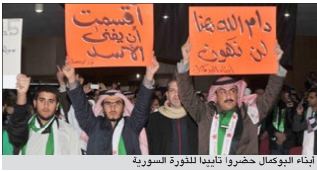
أبناء البوكمال حضروا لتأييد للثورة السورية

وفي اتصال هاتفي من سورية، أكد أمين سر المجلس العسكري في الجيش السوري الحر العقيد عامر الواوي أن ضمير الكويت الحر يساند الشعب السوري، موجهاً التحية للشعب الكويتي حكومة وشعباً، لافتاً إلى أن أفراد الجيش السوري الحر اقموا على مساندة