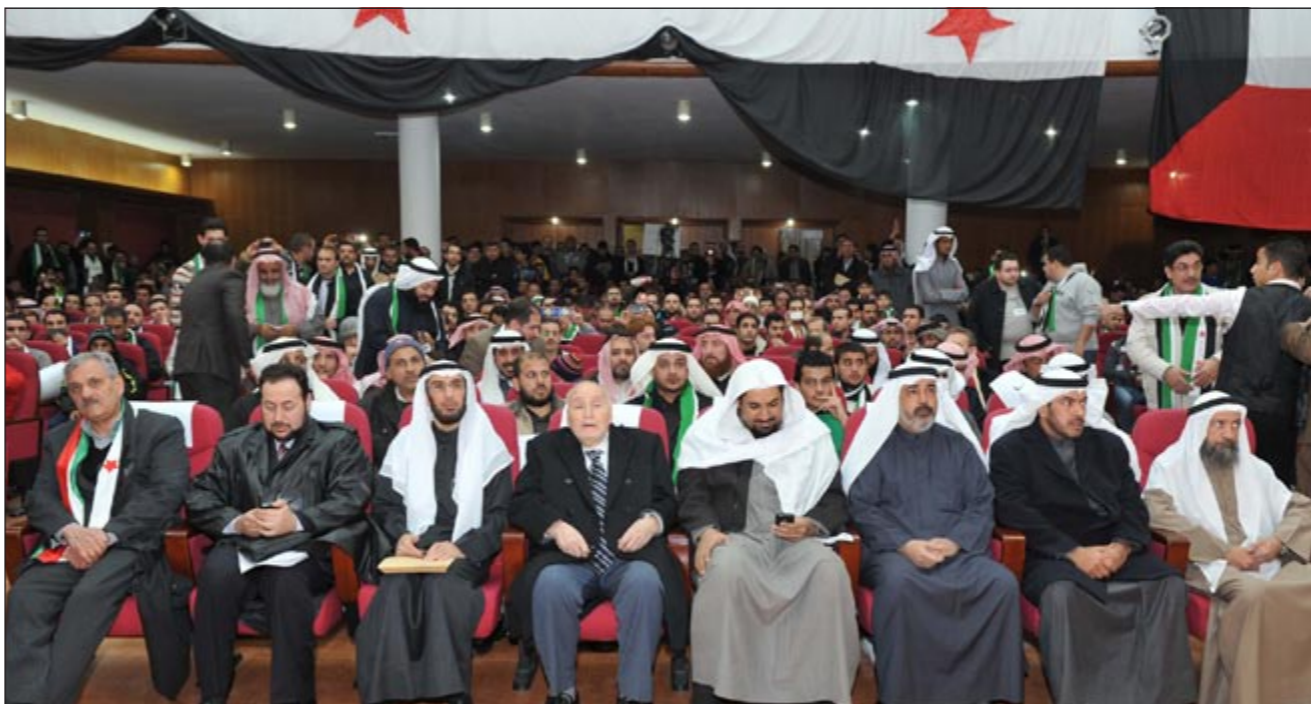
جمع غفير في يوم الغضب العالمي لنصرة الشعب السوري