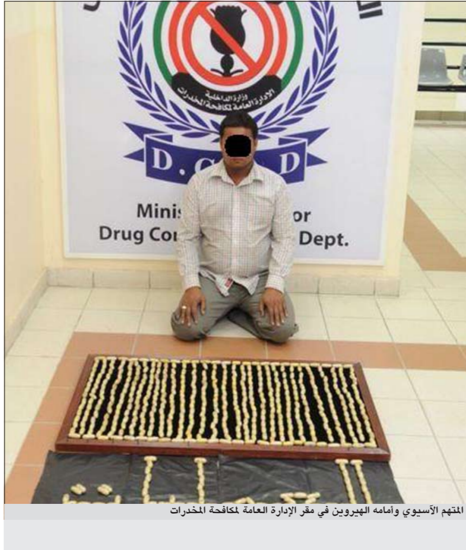
المتهم الأسبوي وأمامه الهيروين في مقر الإدارة العامة لمكافحة المخدرات

تمكنت إدارة العمليات التابعة للإدارة العامة لمكافحة المخدرات من ضبط شاحنة يقودها أسبوي الجنسية، وذلك بعد ورود معلومات تفيد بأن هناك كمية من الهيروين في طريقها إلى الكويت قادمة من دولة خليجية عبر البر وبناء على تلك المعلومات تم التنسيق بين الإدارة العامة لمكافحة المخدرات وإدارة العمليات، ومكتب التحري الجمركي، حيث تم ضبط الشاحنة أثناء دخولها إلى الكويت وذلك بحضور قوة المخدرات والجمارك وبتفتيشها تم العثور على 6 كيلوغرامات ونصف الكيلو من الهيروين الخام على شكل كبسولات وعددها 702 كبسولة تقدر قيمتها بـ 200 ألف دينار وأنها الأكبر هذه السنة وبمواجهة المتهم اعترف بالواقعة بأن هذه الكمية للترويج بين المتعاطين. واستناداً إلى بيان صادر عن وزارة الداخلية أوعز وكيل وزارة الداخلية المساعد لشؤون الأمن الجنائي بالإنيابة اللواء الشيخ أحمد الخليفة إلى مدير عام الإدارة العامة لمكافحة المخدرات بالإنيابة العميد صالح الغنام بسرعة ضبط من وراء هذه الكمية، هذا، وقد تمت إحالة المتهم والمضبوطات إلى النيابة.