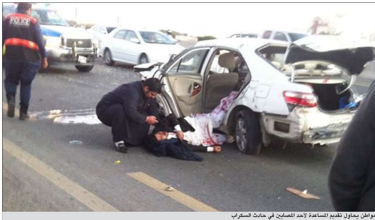
مواطن يحاول تقديم المساعدة لأحد المصابين في حادث السكراب

امس الاول مستشفى الجهراء اثر اصابات متفرقة لحقت به جراء حادث تصادم وقع على الطريق الفاصل في جسر السكراب وتم تسجيل قضية. وقال مصدر أمني إن بلاغا ورد إلى غرفة عمليات الداخلية من أحد المارة يفيد بوجود حادث تصادم بين مركبتين يابانية وأخرى أميركية ليجت على الفور رجال المرور إلى موقع البلاغ حيث