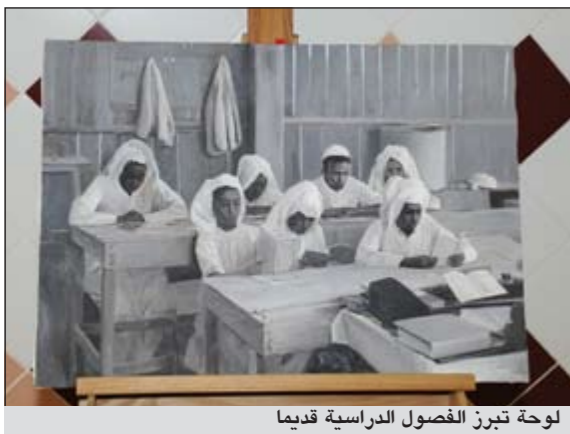
لوحة تبرز الفصول الدراسية قديماً