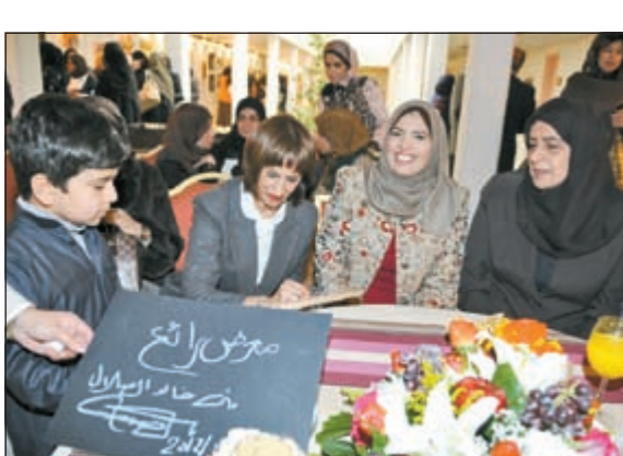
الصالل تشيد بالمعرض بتوقيعها على إحدى اللوحات