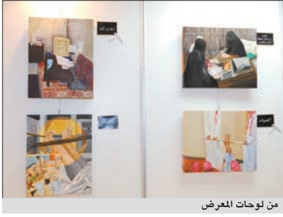
من لوحات المعرض