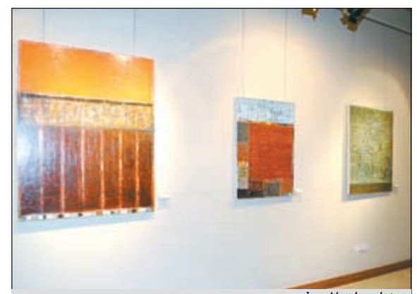
من لوحات المعرض