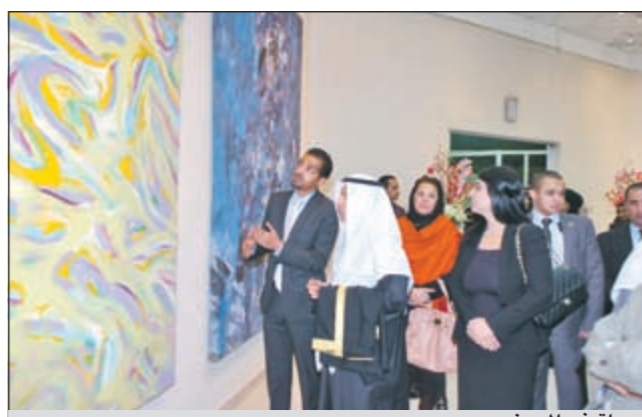
جولة في المعرض