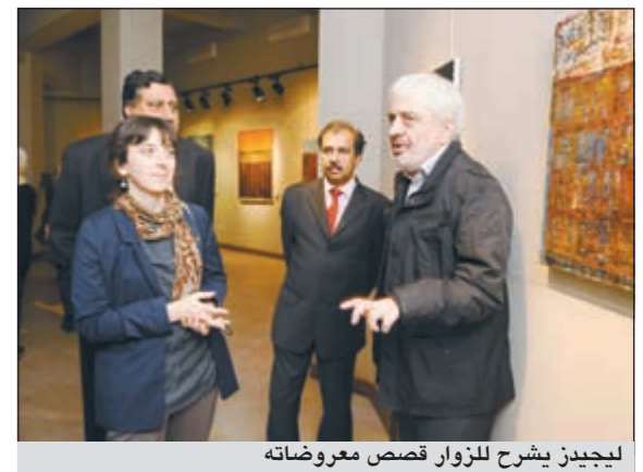
ليجيدز يشرح لزوار قصص معروضاته

تعتبر لوحات الفنان الجورجي ليفان ليجيدز بمثابة جسر من التواصل الحضاري والانفتاح على ثقافة الآخر، وذلك في أول معرض جورجي يقيم على أرض الكويت في متحف الفن الحديث ضمن مهرجان القرين الثقافي وقد افتتحه الأمين العام للمجلس الوطني للفنون والثقافة والآداب على البويعه وبحضور مدير إدارة الفنون التشكيلية محمد العسوس وسفير جورجيا في الكويت كاتريا ميكايتزا. عبر الفنان عن أفكاره برؤية واضحة وذات أبعاد إنسانية عن طريق معالجه لمسألة اللون وتناغمه مع المواضيع المطروحة، وفق تداعيات فنية، تتحرك في اتجاهات مختلفة ومن يتأمل بلمس قدرته على إيصال مشاعره إلى وجدان المتلقي من خلال الاعتماد على عناصر اللوحات باللجوء إلى خطوط لونية متعددة، وترى الأمانة العامة للمجلس الوطني أن تجربة الفنان الجورجي ليفان ليجيدز هي إحدى الصياغات الجديدة التي تشهد بها الحركة التشكيلية المعاصرة بعد ظهور تيارات ومدارس تؤكد ما تعرضت له من تحول في الرؤية الفنية وتبدل في مفهوم اللوحة والواقع. ومن الجدير بالذكر أن ليجيدز تخرج في عام 1981 وترأس في الفترة من 1983 - 1987 استديو الإبداع للفنون الجميلة وشغل منصب رئيس مجلس إدارة اتحاد الفنانين الشباب في جورجيا.