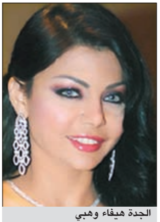
الجددة هيفاء وهبي

هيفاء وهبي حفيذة الفنانة هيفاء ابنتها. ولكن اليوم، بعدما تزوجت الابنة وتبدلت الظروف، لم يعد هناك من داع لهذا البعد، في حين تم الاعتقاد أن هذا الزواج سيثمر عن لقاء الأم والابنة، لاسيما أن كلا الطرفين قد أعربا عن رغبة في هذا اللقاء. وهنا، لابد من التساؤل حول سبب إجحام هيفاء وهبي عن إثارة موضوع ابنتها مجددا، حتى أنها لم توجه لها أي رسائل مباشرة أو غير مباشرة تهدف إلى تقرب المسافة، فهل بهتت مشاعر الأمومة لدى هيفاء المتلهفة ببورها إلى إنجاب أولاد؟ أم أن الزمن قد لعب دورا في خفوت هذه المشاعر؟ بعض العارفين بطبيعة هيفاء يعتبرون أن تسليط الضوء مجددا على هيفاء وهبي - الأم بعد أن أصبحت ابنتها صبية راشدة ومتزوجة، قد ينعكس عليها سلبا كونها تعتبر رمز الجمال والشباب، وأنها قد كبرت بعض الشيء في السن، ولو أن هذه هي سمة الحياة، فكم بالحري أن تنجب الابنة طفلتها