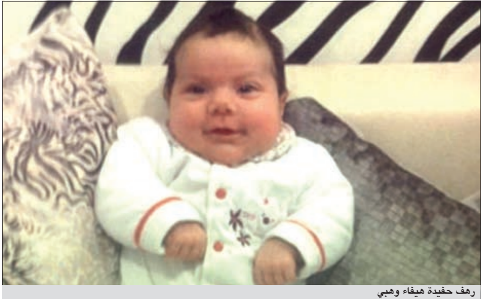
ريف حفيذة هيفاء وهبي

الأولى أي حفيذة هيفاء وهبي، ما يعتبر مؤشرا «خطيرا» على مسيرة هيفاء الفنية التي تستند بالدرجة الأولى إلى جمالها وشبابها.