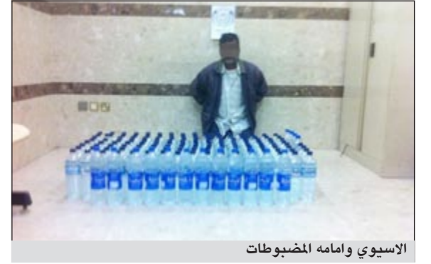
الاسوي وامامه المضبوطات

أحال مدير امن محافظة الأحمدى العميد عبداللطيف الوهيب وافدا آسيويا الى مقر الادارة العامة لمكافحة المخدرات بعد ان ضبط في مركبته 184 زجاجة خمر محلية، وقال مصدر امني ان الآسيوي ضبط على مقربة من ام الهييمان حيث توقف اضطراريا جراء حملة امنية وبدا عليه الارتباك ليكشف عن حيازته واتجاره في الخمر.