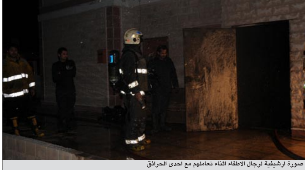
صورة ارشيفية لرجال الاطفاء اثناء تعاملهم مع احدى الحرائق