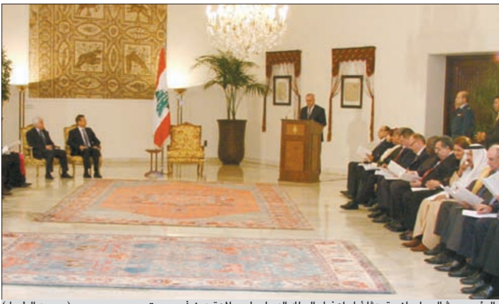
الرئيس ميشال سليمان متحدثا أمام أعضاء السلك الدبلوماسي المعتمدين في بيروت

واعتصم سكان عمارتين مجاورتين اخليتا خشية السقوط مطالبين بالعودة الى بيوتهم.