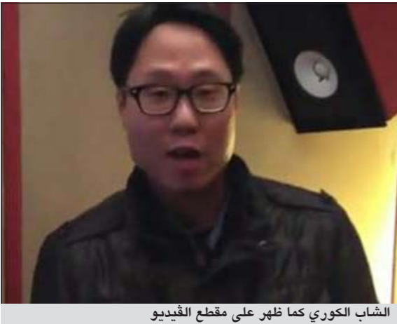
الشاب الكوري كما ظهر على مقطع الفيديو

ام بي سي: تجاوز فيديو لشاب كوري يغني فيه مقطعا من أغنية «فيسبوكي» لأحمد مكي ربع مليون مشاهدة في أقل من أسبوع على موقع الفيديو الشهير «اليوتيوب». الشاب -كما ظهر في الفيديو- حديث العهد باللغة العربية، وأطلق على نفسه اسم «أبو كلثوم»، في إشارة إلى جمال صوته مثل كوكب الشرق «أم كلثوم». وحرص في بداية الفيديو على تقديم المصيرين، قائلا: إنه يحب المصريين للغاية، ولذلك يهديهم أغنية «فيسبوكي» الشهيرة للنجم الكوميدي أحمد مكي. ورغم أن النطق بالكلمات عند الشاب لا يبدو واضحا، إلا أنه استحوذ على إعجاب كل من سمعه لحنة ظله، وحرصه على تعلم اللغة العربية.