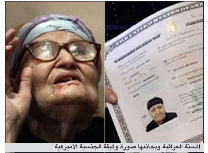
المسنة العراقية ويجانبها صورة وثيقة الجنسية الأميركية