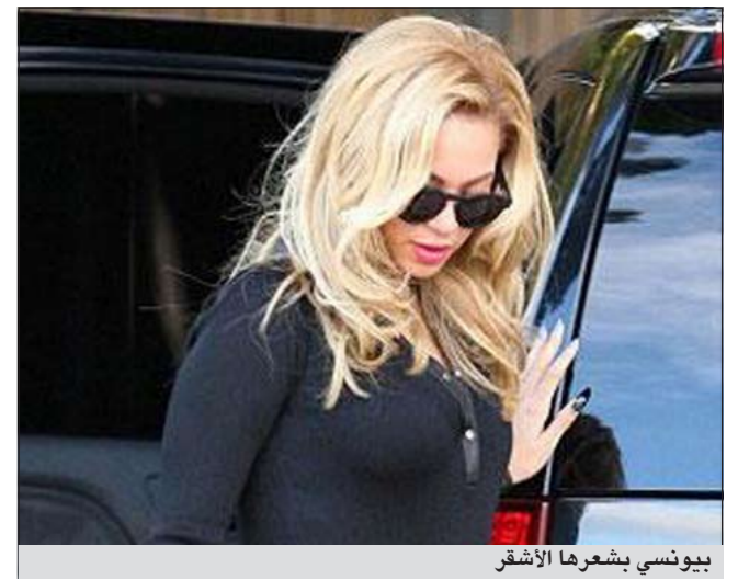
بيونسي بشعرها الأشقر

واجهت المغنية بيونسي عدة انتقادات بسبب محاولة تبييض بشرتها كما ظهرت في أحد الإعلانات عام 2008، كما وجه انتقادات واسعة للشركة العالمية لوريال بسبب استخدام تقنية الفوتوشوب لتفتيح بشرتها، كما ظهرت بيونسي في شهر فبراير بشعر أشقر جدا، وهي ترتدي ثوبا أسود قصيرا وبشرة