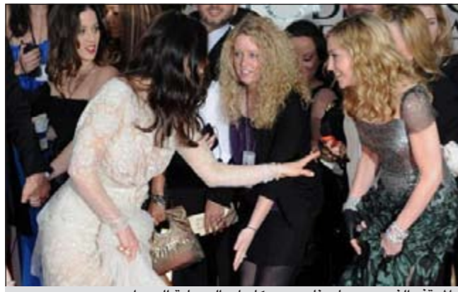
الموقف الذي جمع مادونا وجيسكا على السجادة الحمراء

الجميع يحاول تجنب وجه مادونا الغاضب، حيث قامت الممثلة جيسكا بيال بالضحك عندما وقفت مادونا على فستان بيال من دون قصد وهي تلتقط الصور قبل دخولها لحضور حفل جوائز غولدن غلوب حيث التفتت بيال بسرعة لتجنب تمرق الفستان من المنتصف بسبب الفتحة التي يتضمنها الفستان، ثم ضحكتها على الموقف لتذهب كل واحدة منهما في اتجاه.