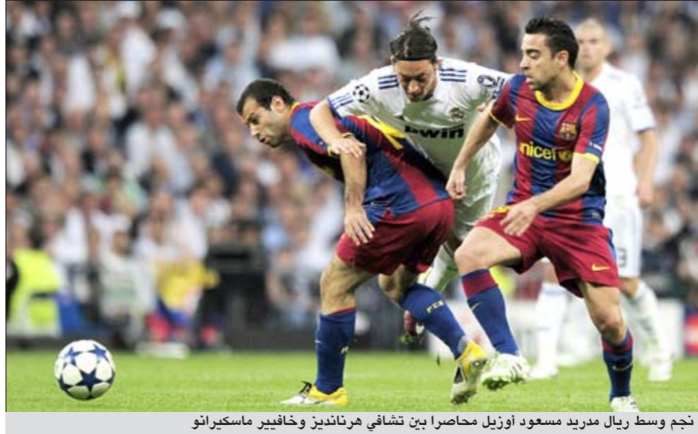
نجم وسط ريال مدريد مسعود أوزيل محاصراً بين تشافي هرنانديز وخافيير ماسكيرانو

وتحمل المباراة تهيبة مميزة، إذ يعيش ريال مدريد، حامل اللقب 18 مرة، فترة رابعة، من خلال تصدره الدوري المحلي بفارق 5 نقاط عن برشلونة بطل الدوري وأوروبا والعالم وحامل الرقم القياسي بعدد القاب المسابقة (25 أحرها عام 2009)، وهو يبحث عن الثأر من الخسارة الأخيرة أمام الفريق الكاتالوني نظراً للعداوة