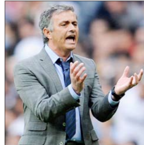
مدرب برشلونة جوسيب غوارديولا تفوق أكثر من مرة على منافسه مدرب ريال مدريد جوزيه مورينيو

يتبع برشلونة ومدربه جوسيب غوارديولا سياسة محددة المعالم وهي اللعب الهجومي سواء اعتمد غوارديولا على ثلاثة مدافعين أو أربعة وسواء اعتمد على المهاجمين المتأخرين أو لم يعتمد عليهم. في المقابل، يواجه مورينيو مازقا حقيقياً في ريال مدريد ويحتاج