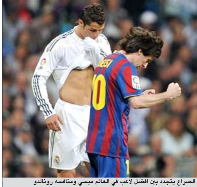
الصراع يتجدد بين أفضل لاعب في العالم ميسي ومنافسه رونالدو