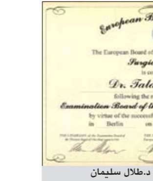
شهادة البورد التي حصل عليها دلال سليمان