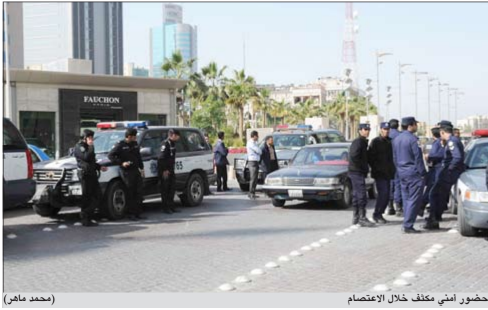
حضور أمني مكثف خلال الاعتصام (محمد ماهر)