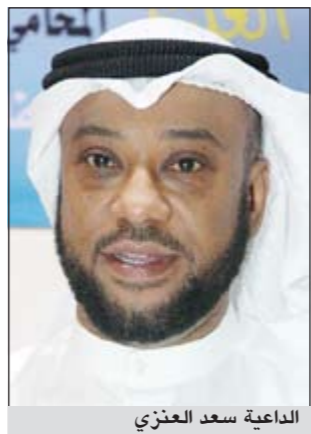
الداعية سعد الغزالي

رسول الله ﷺ عندما دخلت عليه أسماء بنت أبي بكر بغير حجاب وقام وقال: يا أسماء إن المرأة إذا بلغت المحيض لم يصلح أن يرى منها إلا هذا وهذا، وأشار إلى وجهه والغلمان خلفهم والنساء خلف الغلمان لحديث أنس ﷺ قال «صليت أنا وبينت في بيتنا خلف النبي ﷺ وأمي خلفنا» متفق عليه. وما يقع اليوم من بعض الخطل في المسجد الحرام ليس هو الأصل وإنما يلجأ الناس إلى ذلك احتباس الزحام وهو الذي يوقعهم في الحرج وليس هذا أمراً شرعياً جائزاً ولو وقع ذلك فإنه على بعض الكراهة التي يفتي بها بعض الفقهاء في صحة صلاة المرأة في الحرم الشريف وألا يكون جسداً لهيئة الجسم ولا معطراً بمخبراً وألا تتشبه به النساء بالرجال ولا يشبهه زي الكافرات، ومعلوم أن المرأة يجب عليها أن تستتر. وأكد د.العنزي (وقبل للمؤمنات يرضين من أنفسهن ويخفين فروجهن ولا يبدين زينتهن إلا لبعوثتهن أو إبتائهن أو ابتاء بعولتهن أو إخوانهن أو بني إخوانهن أو نسائهن أو ما ملكت أيمانهن أو التابعتين غير أولي الإربة من الرجال أو الطفل الذين لم يظهروا على عورات النساء ولا يضربن بأرجلهن ليعلم ما يخفين من زينتهن وتوبوا إلى الله جميعاً أيها المؤمنون لعلكم تفلحون) ومن هذه الآية يتبين أن المطلوب أن تجعل المرأة غطاء الرأس على النحر والصدر وقال