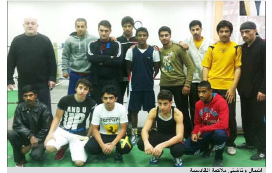
أشبال وناشئي ملاكمة القادسية