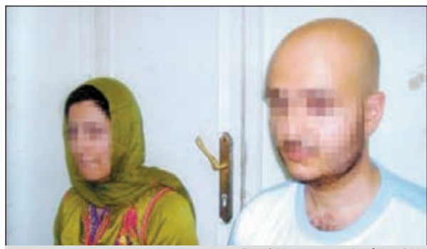
المذيع الأردني وزوجته المغربية