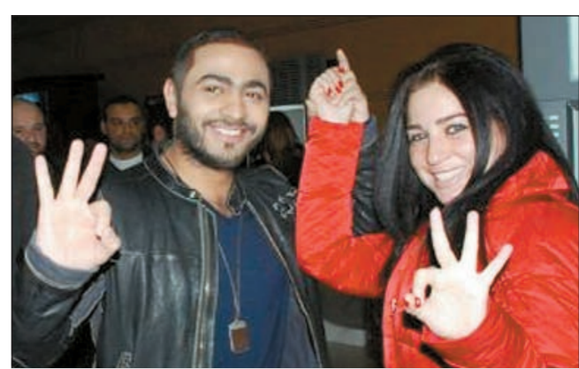
تامر حسني ومي عز الدين في العرض الخاص لفيلم «عمر وسلمي 3»

للوقوف على التحضيرات النهائية لجولته الغنائية هناك والتي ستستمر لمدة شهر تقريباً. وكان من المفترض أن يسافر تامر إلى أميركا في الأول من شهر فبراير المقبل على أن تبدأ أولى حفلاته في الثالث من الشهر نفسه