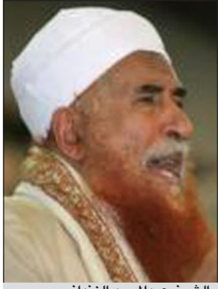
الشيخ عبدالمجيد الزنداني

التابع للزنداني اول من امس «أن تصريحات مديرة البرنامج الوطني السعودي لمكافحة الإيدز لا تنم إلا عن رغبتها الشخصية في تشويه الإنجاز العلمي في هذا المجال، لأغراض لا تخدم من يسعون لإنقاذ البشرية من هذه الأمراض المستعصية والخبيثة، ولا تخدم المرضى في السعودية، التي كان لها الفضل في وضع الإمكانيات اللازمة تحت يد الشيخ عبدالمجيد الزنداني في الثمانينيات من القرن الماضي، عندما كان يجري تجاربه الأولى على تركيبة العقار المستخدم اليوم لعلاج هذه الأمراض».