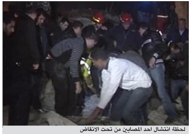
لحظة انتشال احد المصابين من تحت الانقاض

وأفادت قناة «أخبار المستقبل» نقلاً عن فوج اطفاء بيروت بأن