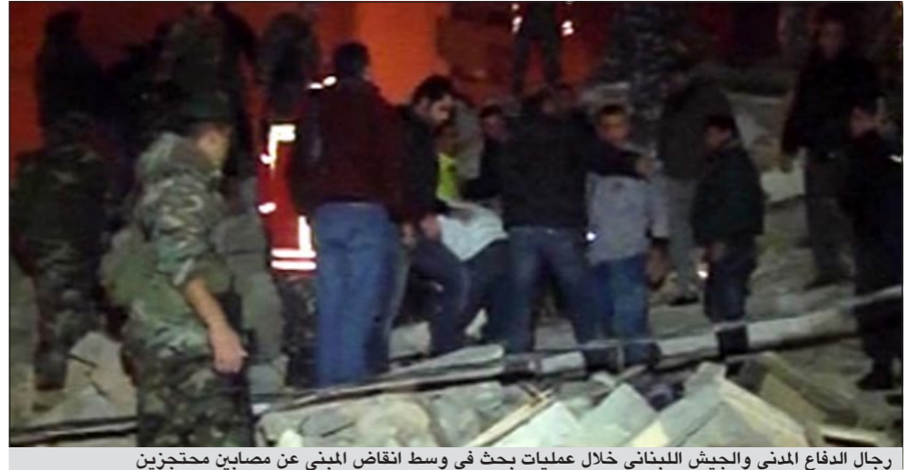
رجال الدفاع المدني والجيش اللبناني خلال عمليات بحث في وسط انقاض المبنى عن مصابين محتجزين