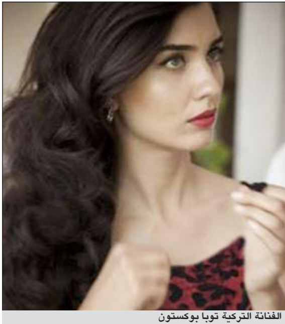
الفنانة التركية توبا بوكستون

وكالات: صرحت الفنانة التركية توبا بوكستون الشهيرة باسم لميس انها كانت تعرف الممثلة هند رستم التي رحلت منذ بضعة شهور كما تعرف الممثل العالمي المصري عمر الشريف، كما تعرف جيداً المخرج اللبناني فيليب عرقنجنج.