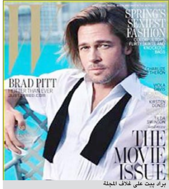
براد بيت على غلاف المجلة

نيويورك - وكالات: اختارت مجلة «W Magazine» الممثل براد بيت (48 عاماً) ليكون على غلافها في عدد شهر فبراير المقبل. وأجرت المجلة معه مقابلة أكد خلالها براد انه لا يبكي كثيراً في أفلامه، «لكن هناك فيلماً واحداً أبكيتي.. عندما كنت قادماً من كابو الى مونتريال وواجهت ما يسمى «revenge s/Montezuma» وهي تعني حالة الإسهال الحاد التي تصيب المسافرين من بلد إلى آخر». وقال براد: «علقت في فندق، بعد هذه الحالة، من دون نوافذ وكنت أقوم بما تقومون به وأنتم في حالة المرض». وبعد يومين وهو على هذه الحالة شاهد فيلماً في «as 2001Life House» «حيث أن كيفن كلاين كان مهندساً معمارياً ويعلم انه مصاب بالسرطان، وكان ينفر من ابنه المراهق، ويظن أن منزله سيدمر ويشاهد كل ذلك أمامه».