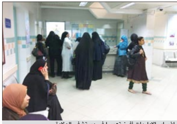
إضراب الإداريات أفرز تعسراً في مستشفى الولادة