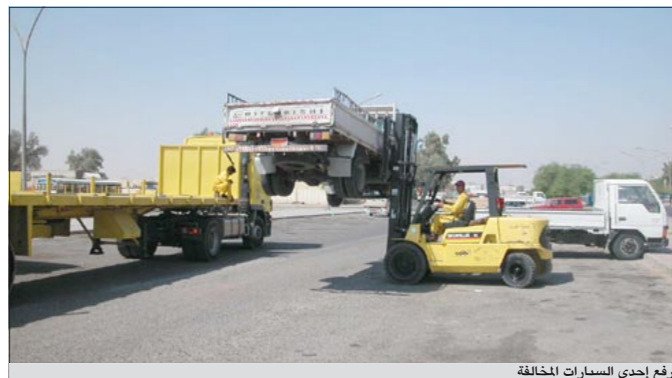
رفع إحدى السيارات المخالفة

مخالفات فقط. وأضاف: لقد بلغ عدد المخالفات التي تم تحريرها للبعاءة المتجولين 410 مخالفات، حيث تصدر شهر تموز قائمة المخالفات والتي بلغ عددها 120 مخالفة، بينما سجل شهر يوليو أدنى معدل وكان عددها 17 مخالفة، لافتاً إلى أن عدد المركبات التي تم رفعها بلغ 802 مركبة، حيث بلغ أعلى معدل منها خلال شهر أكتوبر 276 مركبة، بينما سجل شهر نوفمبر أدنى معدل وهو 91 مركبة. وأوضح العازمي أن عدد التراخيص التي تم إصدارها خلال النصف الثاني من العام الماضي 2011 بلغ 223 ترخيصاً، حيث سجل شهر ديسمبر أعلى معدل وهو 55 ترخيصاً فيما حل شهر أغسطس في المرتبة الأخيرة مسجلاً 22 ترخيصاً، مشيراً إلى أن إجمالي الإيرادات التي تم تحصيلها قد بلغ 106938 ديناراً.