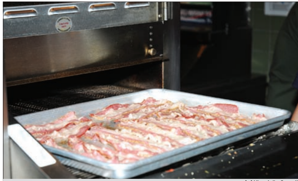
الجودة والطعم اللذيذ