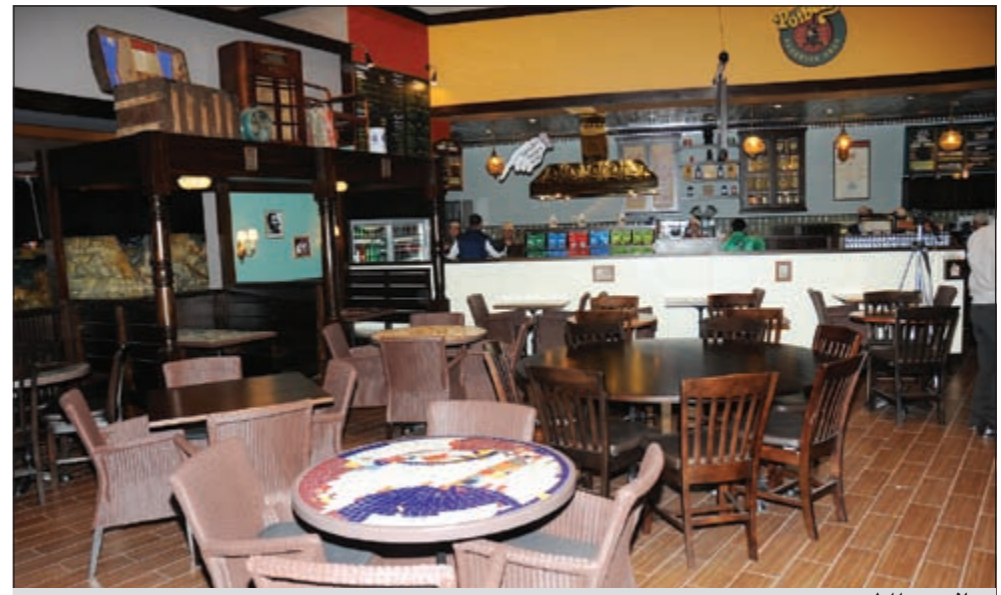
جانب من المطعم