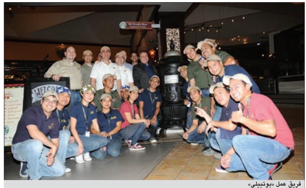
فريق عمل «بوتبيلي»