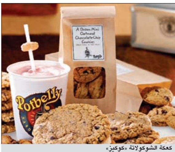
كعكة الشوكولاتة «كوكيز»