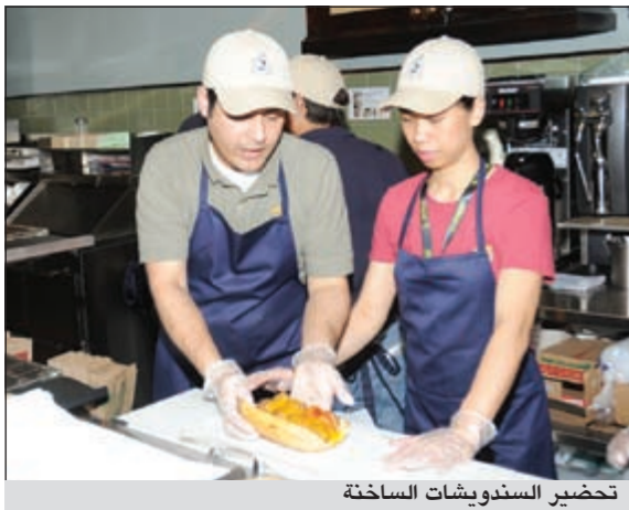
تحضير السندويشات الساخنة