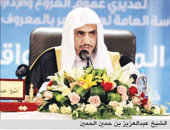
الشيخ عبدالعزيز بن حميد الحمين

الرياض - أ.ف.ب: أعلن مصدر رسمي أن العاهل السعودي الملك عبدالله بن عبدالعزيز أعفى الجمعة رئيس عام هيئة الأمر بالمعروف والنهي عن المنكر، الشيخ عبدالعزيز بن حميد الحمين من منصبه من دون ذكر الأسباب.