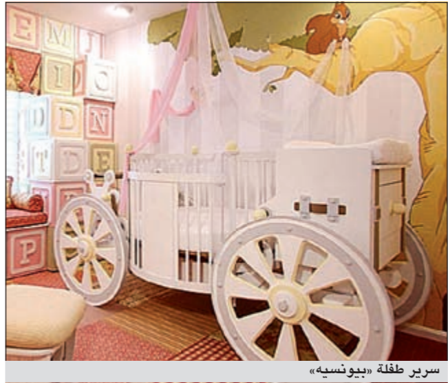
سرير طفلة «بيونسيه»

ويضيف أن هذا النظام سيعتمد على المدى الطويل في «الكمبيوترات المحملة والأجهزة اللوحية»، في تطبيقات لا تخاطر على بال.