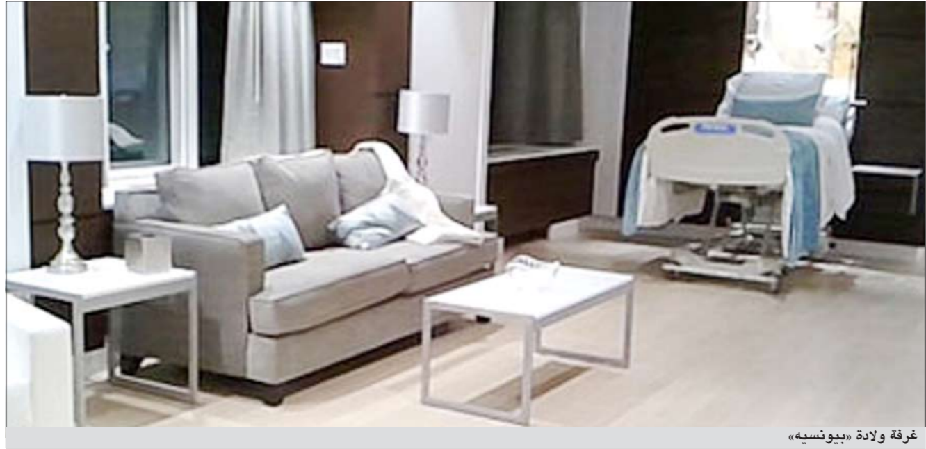
غرفة ولادة «بيونسيه»

وفقاً لما نشرته TMZ، كما أن الغرفة احتوت على أثاث فخم، وطاولة طعام. وسيحصل الزوجان على مبلغ يقدر بـ 2 مليون دولار عند بيعهما الصور الأولى لطفتيهما، بلو إيفي كارتر، علماً أن ذلك المبلغ يعتبر زهيداً مقارنة بالمبالغ التي حصل عليها نجوم آخرون عند نشرهم صور أطفالهم لأول مرة في الصحافة.