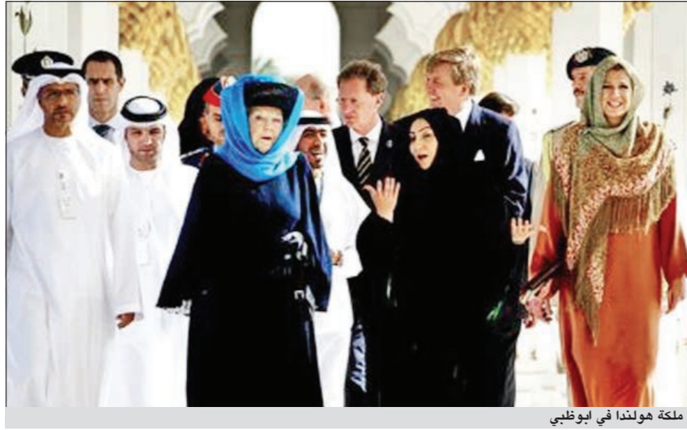
ملكة هولندا في ابوظبي

أمستردام - د.ب.أ: رفضت الملكة بياتريكس، ملكة هولندا، انتقادات التمسار الميمني في بلادها لارتدائها وشاح رأس أنفء زيارتها إلى العاصمة الإماراتية ابوظبي، واصفة إياها بأنها «هراء»، حسبما ذكرت الإذاعة العامة الهولندية.