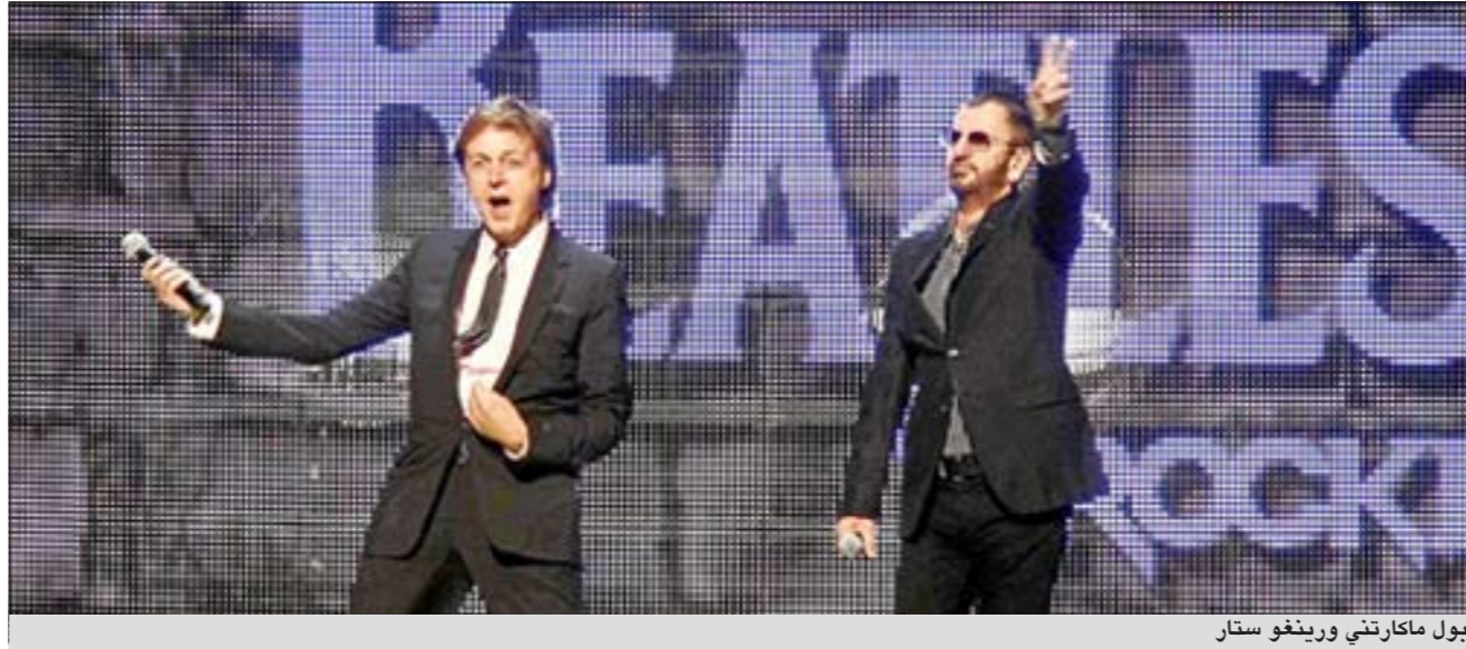
بول مكارتنى ورينغو ستار

الفرق الموسيقية والغنائية لأن تظهر الى الوجود، وتحتل موقعها على الساحة الفنية. وكان فريق «البيتلز» قد حقق شهرة واسعة، في كل مكان من أرجاء العالم، إلا أن جون لينون قتل، بينما توفي جورج هاريسون بسبب مرض السرطان، أما بول مكارتنى ورينغو ستار، فقد بقيا على قيد الحياة، لتمتعهما بصحة جيدة، وأمتلكهما لثروة كبيرة، واستمرارهما في مجال الفن الموسيقي، الأمر الذي أحالهما الى أسطورتين.