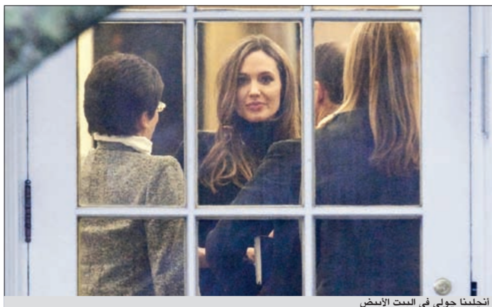
أنجلينا جولي في البيت الأبيض

واشنطن - أ.ف.ب: استقبل الرئيس الأميركي باراك أوباما الثلاثاء الشهير براد بيت وأنجلينا جولي في المكتب البيضاوي لمناقشة التدابير المتخذة لمكافحة العنف ضد المرأة، بحسبما كشف لوكالة «فرانس برس» مسؤول من البيت الأبيض.