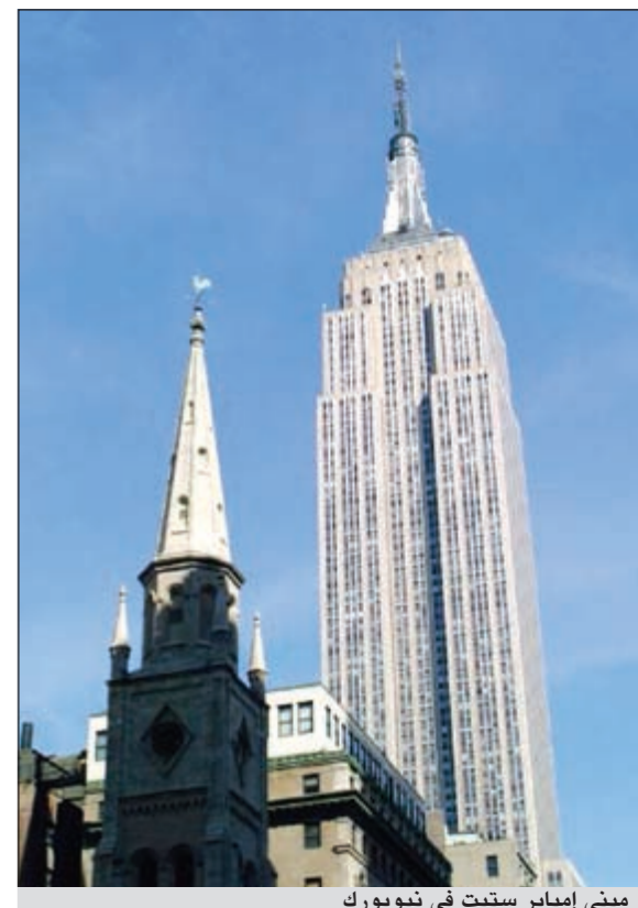
مبنى إمباير ستيت في نيويورك

لندن - رويترز: أفاد تقرير لشركة باركليز كابيتال بأن هناك «علاقة غير صحيحة» بين بناء ناطحات السحاب والانهيارات المالية.