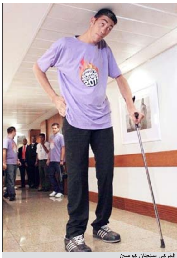
التركي سلطان كوسين

إسطنبول - وكالات: تواصل قامة المواطن التركي سلطان كوسين الزيادة في الطول ويدها في النمو عقب حصوله على لقب أطول رجل في العالم في نسخة كتاب «موسوعة غينيس للأرقام القياسية» لعام 2010، وسجلت قامته أطول قامة بطول يبلغ مترين و46,5 سنتيمتراً ويدها بطول قدره 27,5 سنتيمتراً ورجلاه التي يبلغ طولهما 36,5 سنتيمتراً. وخلال القياسات التي يقفها الحكام في موسوعة «غينيس» لطباعة نسخة 2012 الموسوعة، سجلت قامة سلطان ازدياداً بلغ 4,5 سنتيمترات لتصل إلى مترين و51 سنتيمتراً، كما نمت يدها لصل طول كل واحدة منهما إلى 28,5 سنتيمتراً. وعلى الرغم من تلقيه لعلاج للهرمونات، فإن طوله لا يزال في ازدياد متواصل.