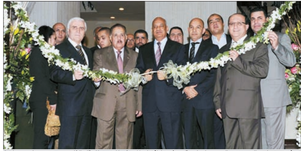
سفير مصر لدى الكويت عبد الكريم سليمان يقص شريط افتتاح المعرض المصري للعقار الثامن

العالمية والتي قد تعطي انطباعاً معيناً يختلف عن الواقع هناك. وأضاف أنه بعد الثورة الحالية فإن ما ظهر على الواقع العقاري هو ظهور المساحات الصغيرة في المناطق الراقية، حيث أن هناك مساحات تبدأ من 90 متراً، وهو أمر لم يكن وارداً في السابق، الأمر الذي يعطي انطباعاً بأن هناك اهتماماً حقيقياً بمغزى الشباب. وأشار سليمان بالسهوليات الكبيرة التي قدمتها الكويت لاستضافة هذا الحدث، حتى أن هناك شركات مصرية - كويتية تشارك في المعرض، الأمر الذي يدل على تلاحم وتكاتف بين الشعبين لدعم الاقتصاد المصري من ناحية وجذب المواطن الكويتي للاستثمار في مصر.