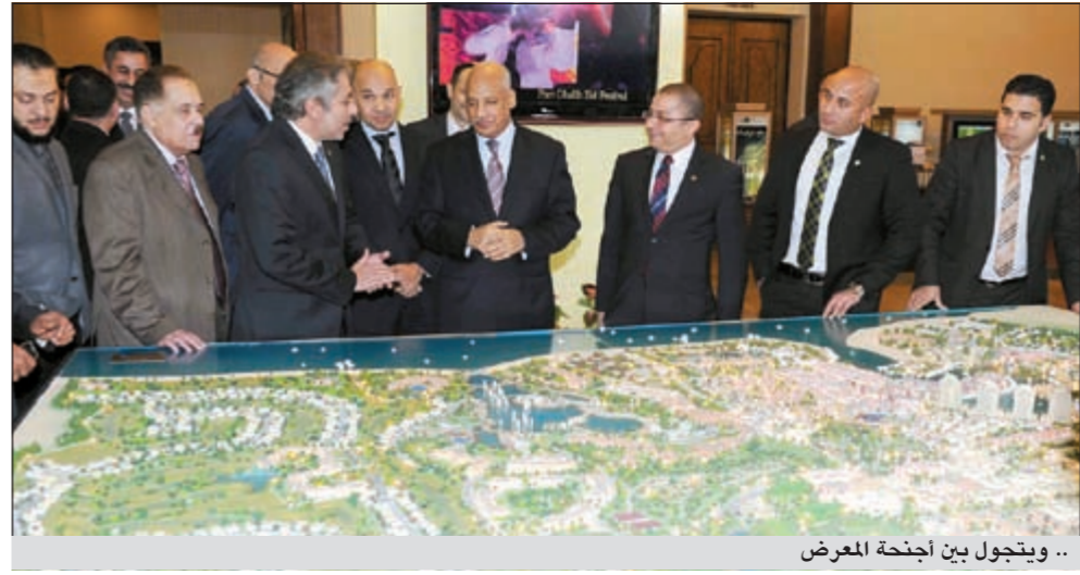
ويتجول بين أجنحة المعرض

بشكل عام. وأشار إلى أن العقار كاستثمار إنما يمثل عصب الحياة الاقتصادية في مصر بشكل خاص والمنطقة العربية بصفة عامة، حيث يعد العقار الوسيلة الأساسية للعيش أو الاستثمار على حد سواء. وأشار إلى أن أهمية هذا القطاع تكمن في ارتباطه بالعديد من الصناعات الأساسية له كصناعة المواد الخام والحديد والأسمنت والرمل والحجر، ناهيك عن خدمات السيراميك والأخشاب والكهرباء، بمعنى أن القطاع العقاري يمكنه أن يحرك العديد من القطاعات الاقتصادية الأخرى ذات العلاقة. ونظراً لأن هذا المعرض العقاري يعتبر أول معرض يقام بعد ثورة 25 يناير في مصر، فإن سليمان بعث رسالة طمأنة حقيقية بأن هناك فرقاً كبيراً بين الواقع الحالي في مصر وما تبته بعض الفضائيات