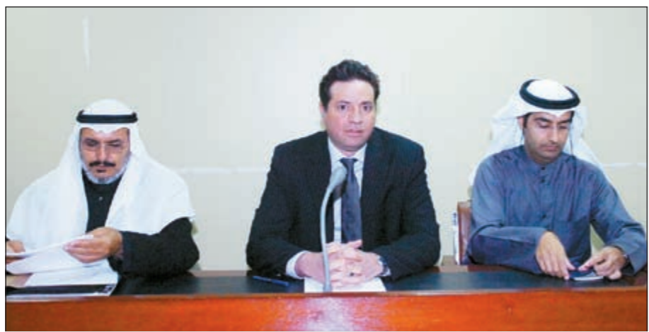
جانب من عومية «إياس للتعليم التقني» (محمد مرسى)

مقارنة بـ 2,1 مليون دينار للفترة المقارنة من العام الماضي حيث تم رد جزء من رصيد مخصص لغاظة مقاول الإنشاء الخاص بالمبنى مما نتج عنه رصيد موجب لبند المصاريف العمومية والإدارية عن السنة الحالية (أيضاً ربح 19 مق من البيانات المالية) ويبلغ معدل استهلاك الأصول الخابطة للسنة الحالية 2,47 مليون دينار مقارنة بـ 2,40 مليون دينار للفترة المقارنة من العام الماضي وتم أخذ مخصص انخفاض في قيمة شركة زيمية بمقدار 381,06 ألف دينار ويرجع ذلك إلى الانخفاض للقيمة السوقية للأرض المشتراة من قبل الشركة الزيمية بنسبة 12,5٪ تحوطاً لهذا الأمر.