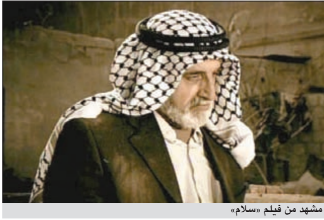
مشهد من فيلم «سلام»