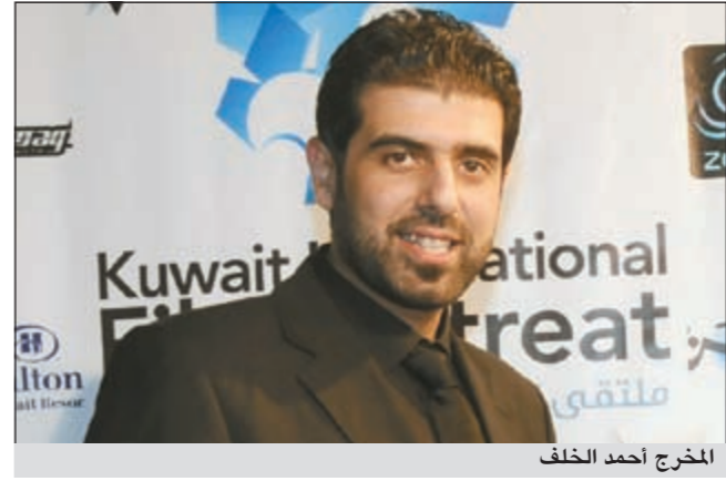
المخرج أحمد الخلف

الدولة التشجيعية في الإخراج السينمائي عن فيلم «هارموني» وذلك من قبل وزير الإعلام الشيخ حمد جابر العلي.