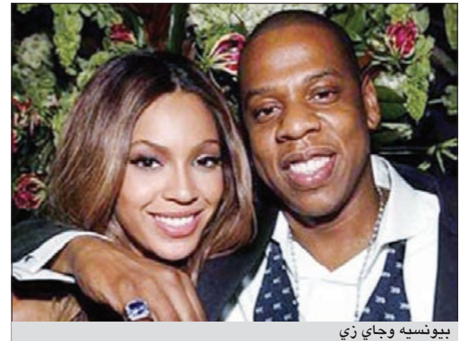
بيونسيه وجاي زي

زي الحماس في نيويورك الثلاثاء. فاحتشد السياح والمصورون أمام مستشفى «لينوكس هيل هوسبيتل» الواقع شرق مانهاتن ليحاولوا رؤية آيفي بلو كارتر التي ولدت السبت ووالديها. وللاحتفاء بهذا الحدث