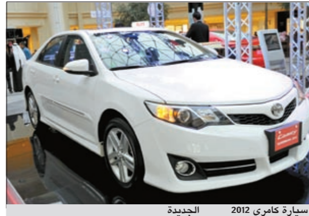
سيارة كامري 2012 الجديدة