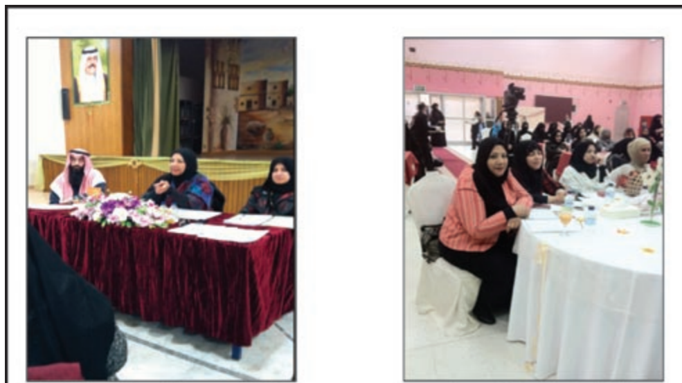
المراقبة في مدرسة العمرة الابتدائية بنات

أكد كريم الزهري، أحد أبرز سائقي السيارات في دولة الإمارات، أنه يتوق لأول مشاركة له في سلسلة تحدي كأس بورش جي تي 3 الشرق الأوسط على الرغم من أنه يعلم صعوبة المنافسة في البطولة خلال النصف الثاني من موسم 2011 - 2012. وسيشارك الزهري للمرة الأولى في سلسلة سباق بورش للسيارات الاحادية الطراز في المملكة العربية السعودية الشهر القادم، بعد أن يتسلم مهامه في تمثيل فريق النابودة للسياقات من البليجيكي ستيفين ليمريت.