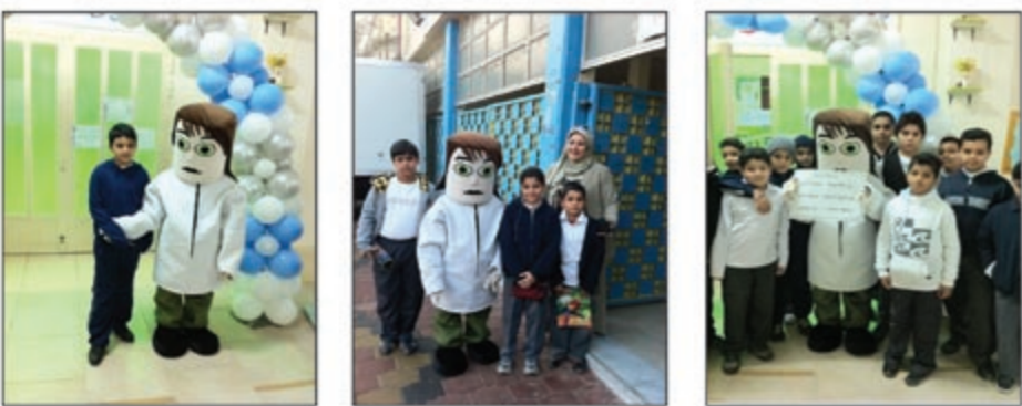
فعاليات مدرسة سفیان الثوري للبنين لجودة التعليم في الإختبار المريح