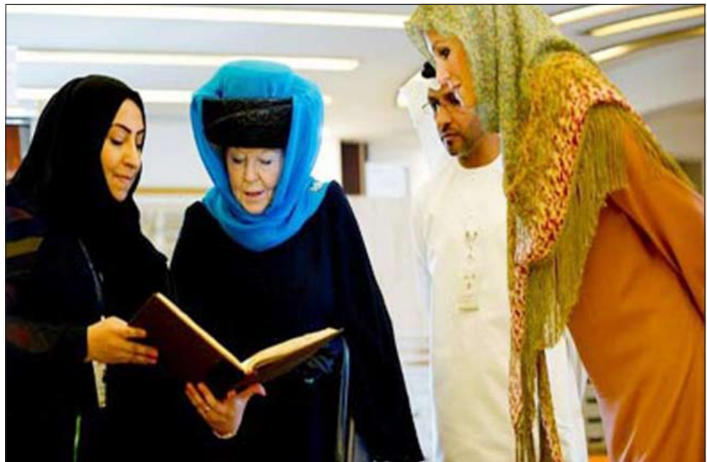
ملكة هولندا في أحد مساجد أبوظبي

والقرآن على الإرهاب. وجوبه برفض داخل هولندا وخارجها. ويعيش السياسي الهولندي اليمني منذ 2004 في وضع أمني خاص، ومحاط بحماية شخصية كبيرة، وعادة ما يغير مكان سكنه، ولا يظهر في المناسبات العامة داخل هولندا أو خارجها إلا محاط بإجراءات أمنية مشددة، ولدى حزبه «حزب الحرية» 24 مقعدا، وهو ثالث حزب من حيث عدد المقاعد في البرلمان، المكون من 150 مقعدا.