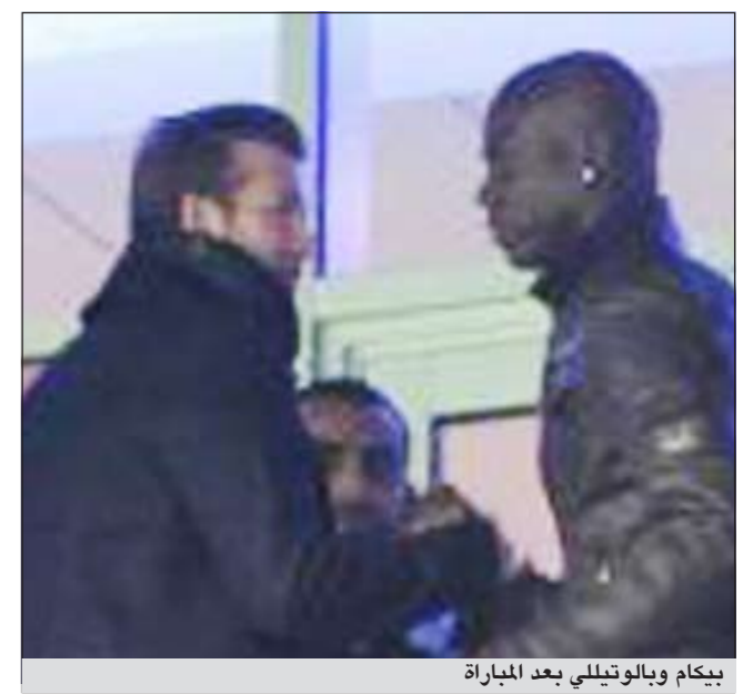
بيكام وبالوتيللي بعد المباراة

الطلب أصاب اللاعب الإيطالي بالصدمة بادئ الأمر كونه أتى على لسان أحد ايقونات يوتيوب، انما عادت الأمور إلى طبيعتها بعد ان تبين ان نجس بيكام «بروكلي» كان السبب في هذا