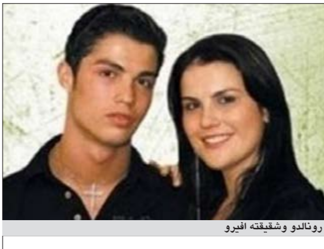
رونالدو وشقيقته افيرو

قامت ايلما افيرو الشقيقة الكبرى للبرتغالي كريستيانو رونالدو نجم ريال مدريد الإسباني بالظهور على غلاف مجلة برتغالية بصور فاضحة، في محاولة منها للتعبير ان ليس فقط رونالدو هو الوسيم، وتقول انها لم تخبر شقيقها عن الموضوع كونها تعرف انه لن يوافق. ووفقا لصحيفة «فوتبول بريميير» البرتغالية فان ايلما افيرو التي تبلغ من العمر 37 عاما، عادت لتظهر على غلاف المجلة في محاولة منها للعودة إلى الأضواء من جديد. وتعدمت الصحيفة ان توضح اسم رونالدو كاملا حين اعتبرت