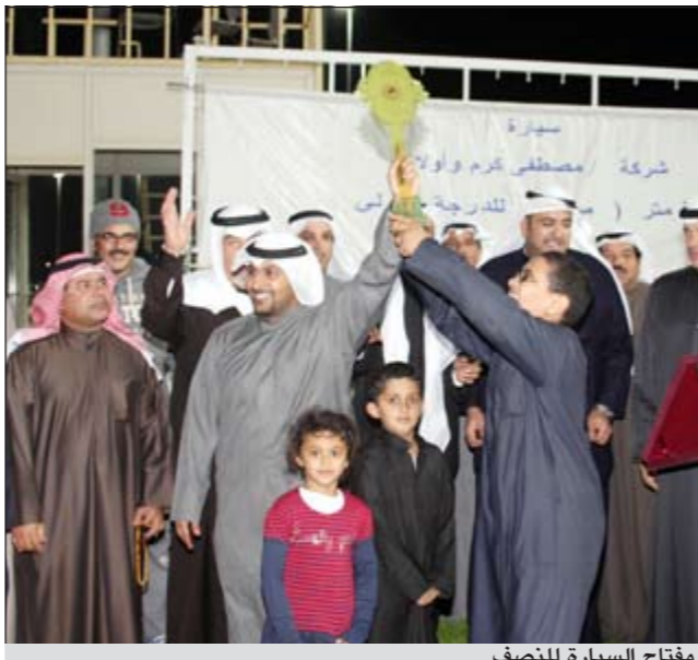
مفتاح السيارة للنصف

تنتقل اليوم في قطر البطولة الآسيوية الثانية عشرة للرمية التي تستمر حتى 22 الجاري بمشاركة أكثر من الف رام ورامية يمثلون 31 دولة. وتحظى البطولة التي ينظمها الاتحاد القطري بإشراف الاتحاد الآسيوي للعبة بأهمية كبيرة لأنها تعتبر مؤهلة التي أولمبياد لندن الصيف المقبل، إذ ستشهد تنافسا على 35 مقعدا إلى الألعاب الأولمبية.