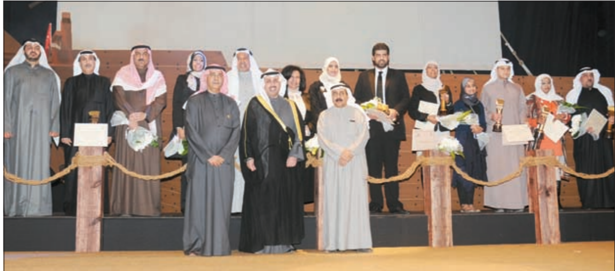
وزير الاعلام الشيخ حمد جابر العلي والامين العام للمجلس م. علي اليوحة يتوسلان الفائزين بالجوائز (أنور الكندري)

وحتى الآن يبحث فريق العمل عن المخرج المناسب للمسلسل، ومن المقرر البدء في اختيار باقي فريق العمل بعد الاستقرار على المخرج، حسب موقع «عيون عالفن». وعلى الجانب الآخر، انتهت أنغام من طرح أغنياتها الخليجية «عش قلبي» من تأليف الشاعر الإماراتي حسان العبيدي ولحنها فايز السعيد، ومن المقرر أن يتم طرحها قريباً. كذلك أوشكت أنغام على الانتهاء من ميني البوم جديد، على أن تطرحه في بدايات أعياد الربيع المقبلة.