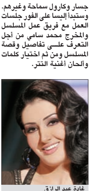
غادة عبد الرزاق

تخوض النجمة اللبنانية إيسا تجربة غناء تترات المسلسلات لأول مرة في مشوارها الفني، حيث تم الاتفاق معها وفي سرية تامة على غناء تتر مسلسل الفنانة غادة عبد الرزاق الجديد «مع سبق الإصرار» المقرر عرضه في شهر رمضان المقبل. وتلقت إيسا، بحسب «اليوم السابع» المصرية، من قبل العديد من العروض لغناء تترات، ولكنها كانت تعتذر، ولذلك فقد اعتبر صنع مسلسل «مع سبق الإصرار» موافقة إيسا وكأنها ضربة معلم فنية، فقد أقتنعوا إيسا لتتضم إلى النجوم الذين غنوا من قبل تترات المسلسلات ومنهم الجسمي ونانسى عجرم وفضل شاعر وهشام عباس وانغام وبهاء سلطان ووائل