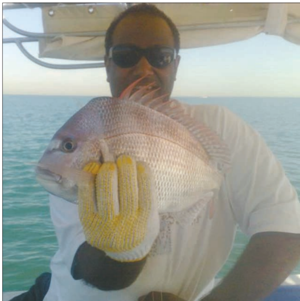
يا سلام على نور العندق