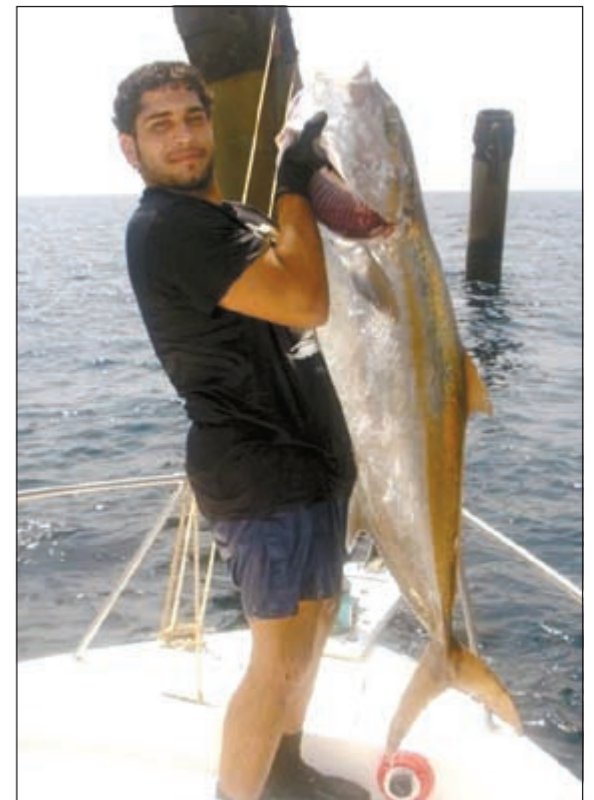
هذا الصيد ولا بلاش