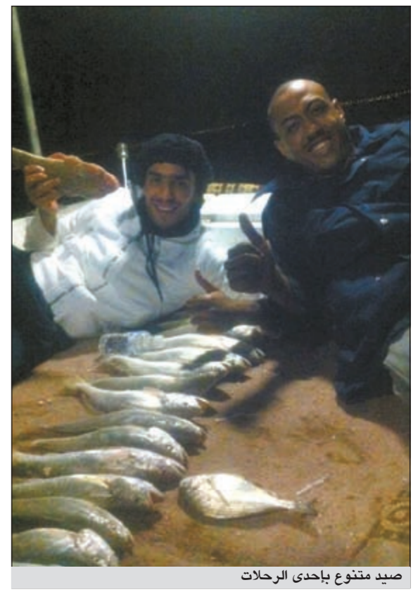
صيد متنوع بإحدى الرحلات