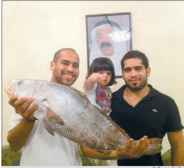
شماهي ولا ازوع