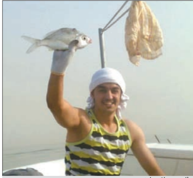
هذا صيدي لكم عليه

يوسف صفحة «بحري» تتعجب من سؤال الكثيرين عن سر المحادق الجنوبية حتى أبناء الخليج في دولهم يتكلمون عن بحر الكويت والمحادق الجنوبية. ● والله العظيم هذا الكلام