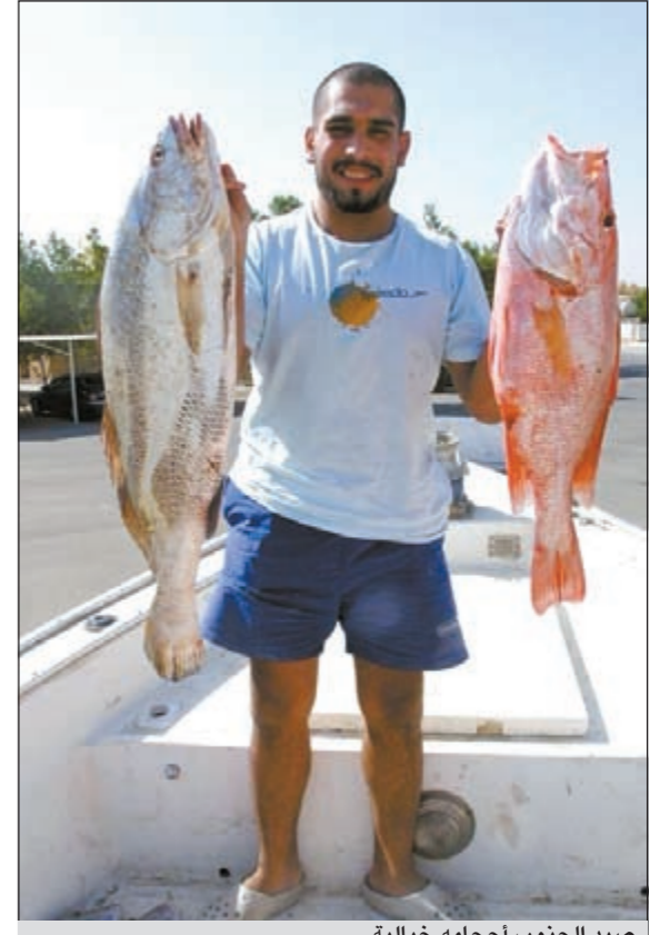
صيد الجنوب أحجامه خيالية