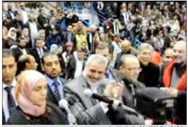
الفرنسية أثناء اشهار اسلامها

وتونس في تونس، وهي المرة الأولى التي يزورها هنية منذ تسلمه منصب رئاسة الوزراء، حيث كان نظام الرئيس التونسي الهارب المخلوع زين العابدين بن علي مولياً ولاء مطلقاً للغرب مقاطع حركة حماس.