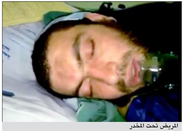
المرضى تحت المخدر

عمان - وكالات: أثار شاب أردني أجرى عملية جراحية مؤخراً دهشة الكثيرين وذلك بعدما فوجئ طبيبه الخاص بتلاوته للقرآن الكريم وهو