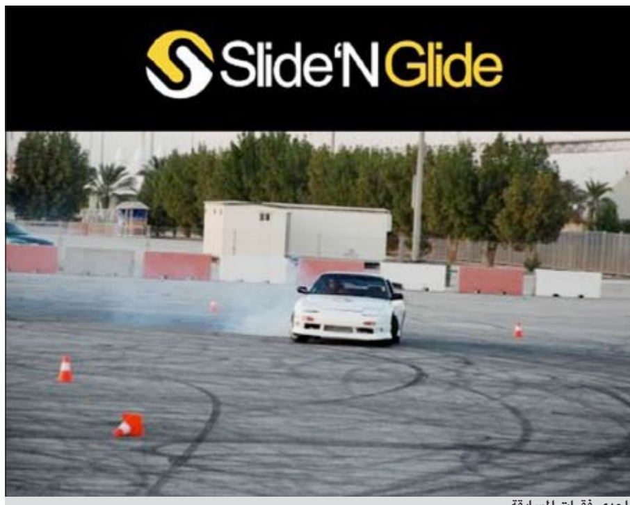
إحدى فقرات المسابقة

المنطقة بهدف دعم وتطوير هذا النوع من رياضة السيارات.