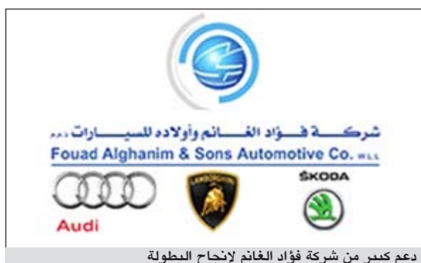
دعم كبير من شركة فؤاد الغانم لإنجاح البطولة

يذكر ان الهدف من تأسيس فريق «سلايد إن غلايد» بالمملكة هو تشكيل كيان يجمع عشاق رياضة الزحلق بالسيارات في المنطقة من اجل المساهمة في تطوير مواهبهم ومهاراتهم وتوفير بيئة آمنة للسواق المهتمين بهذه الرياضة لممارسة هوايتهم في جو من المرح والتشويق، بالإضافة الى دعم الانشطة الخيرية والانسانية في المجتمع والحصول على اوقات ممتعة وملينة بالفرح للجمهور العاشق لهذه الرياضة.