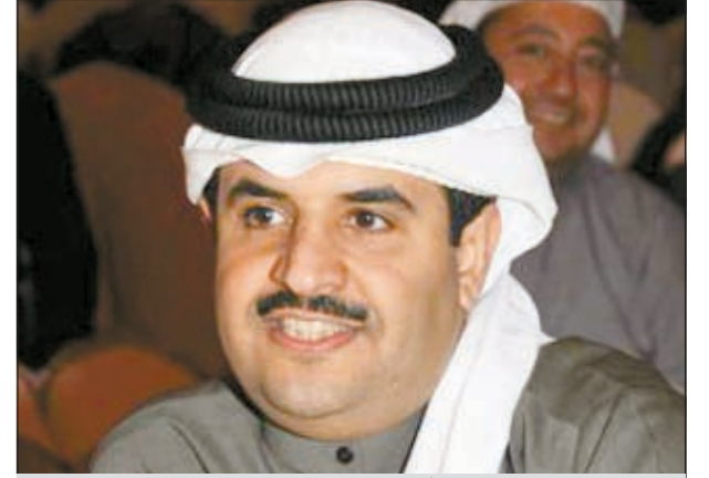
الشاعر الشيخ دعيج الخليفة

هذان العلمان رضاء الجمهور، خصوصاً أنهما من غناء صوتين كويتيين واعدين. الألمان الناجحة لكبار النجوم في الكويت والخليج، مشيراً إلى أن الأغنية الأولى التي ستجمعها تحمل اسم «هارد لك»، وستصنّف لغنائها نجم «ستار أكاديمي» الفنان الشاب عبدالعزيز لويش وهي من توزيع عادل الفرخان و«ميكس» صهيب العوضي. وأضاف الخليفة: كما تعاون معه من خلال أغنية لنجم آخر من نجوم «ستار أكاديمي» وهو إبراهيم دشتي وعنوانها «مشتاقين»، متمنياً أن ينال