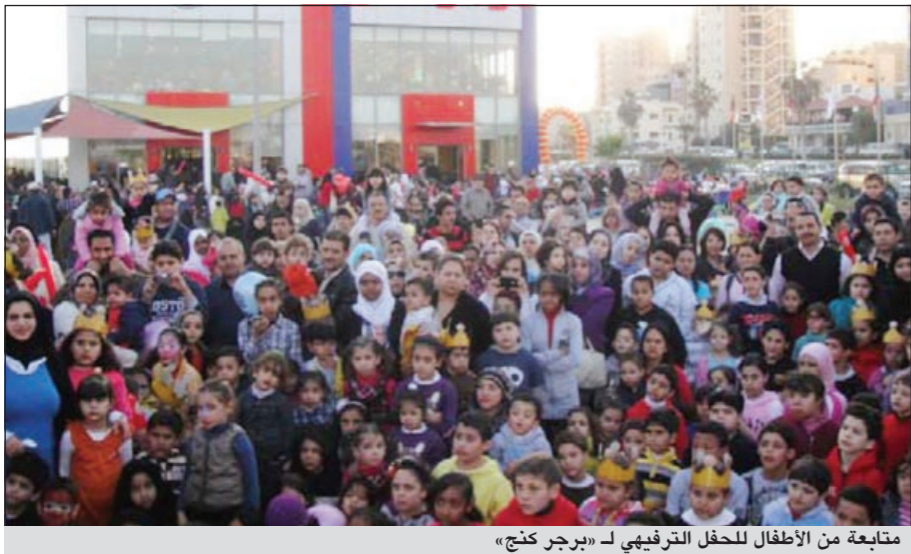
متابعة من الأطفال للحفل الترفيهي لـ «برجر كنج»

التي تجلت من خلال حماسهم وتهاوتهم للمشاركة في جميع المسابقات. ويأتي هذا الحفل ضمن سلسلة النشاطات التي تنحصر مطاعم برجر كنج على إقامتها بشكل دائم منذ أكثر من 14 عاماً بهدف مشاركة الأطفال فرحتهم في جميع المناسبات والترفيه عنهم. وتحتد الإشارة إلى ان سلسلة مطاعم برجر كنج التابعة لمجموعة كسوت الغذائية تملك 59 فرعاً منتشرة في جميع أنحاء الكويت تعمل على تقديم اعلى مستويات الجودة للمنتجات والخدمة المميزة منذ انطلاقتها في العام 1997.