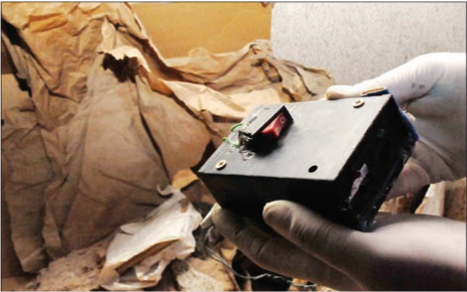
صورة المتفجرة التي مكنتها قوى الأمن اللبناني في صيدا الخميس الماضي بعد القبض على مركبها (محمود الطويل)

الثورة السورية وقمع اخوانهم الذين عاشوا معهم واستقروا معهم، وهو جزء من هذا الشعب، وهو نسيج اساسي في سورية العربية المنفتحة التي يجب أن تحصل على حقوق شعبيها من خلال انتفاضة. شهيد الذي كان يتحدث لقناة الـ «بي.بي.سي» لم يخف قلقه من انعكاسات موقف بعض ابناء الطائفة الدرزية على الطائفة نفسها في حال سقوط النظام السوري.