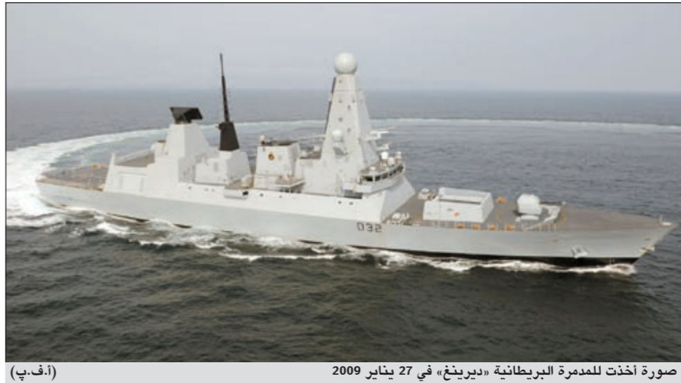
صورة أخذت للمدمرة البريطانية «ديرينغ» في 27 يناير 2009

لندن - وكالات: أرسلت بريطانيا أحدث سفنها الحربية إلى الخليج للقيام بأول مهمة مقررة منذ أكثر من عام، لكنها تتم وسط توتر بين الغرب وإيران بشأن مضيق هرمز.