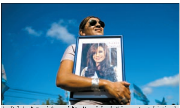
أرجنتينية تحمل صورة الرئيسة قرب المستشفى حيث أجرت العملية

والدمرة «ديرينغ» هي الأولى من ست مدمرات جديدة ستحل محل السفن البريطانية من نوع 42 الموجودة في الخدمة منذ 1970. إلى ذلك، قال ديبلوماسيون ومصادر صناعة النفط لـ «رويترز» ان الدول الغربية أعدت هذا الأسبوع خطة طوارئ لاستخدام كمية كبيرة من مخزونات الطوارئ للتعويض تقريباً عن كل نفط الخليج الذي سيغلق إذا أغلقت إيران مضيق هرمز. وأضافوا قولهم ان مديري كبرياء في وكالة الطاقة الدولية التي تقدم النصح إلى 28 دولة مستهلكة للنفط ناقشوا الخميس خطة قائمة