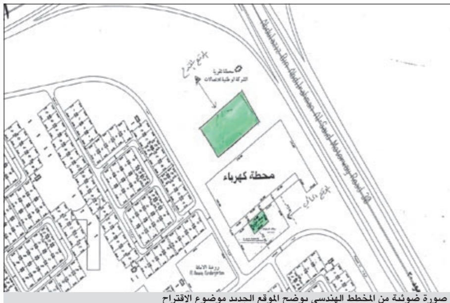
صورة ضوئية من المخطط الهندسي يوضح الموقع الجديد موضوع الاقتراح

وكذلك توزيع كوبونات على عائد المشتركين بما يقارب 5/7 الأمر الذي أنفردت به جمعية الروضة عن جميع الجمعيات التعاونية وكانت هذه مفاجأة جديدة فاقت توقع السادة المساهمين عند مقارنتها بالهدية الرمضانية التي تقدمها الجمعيات الزميلة.