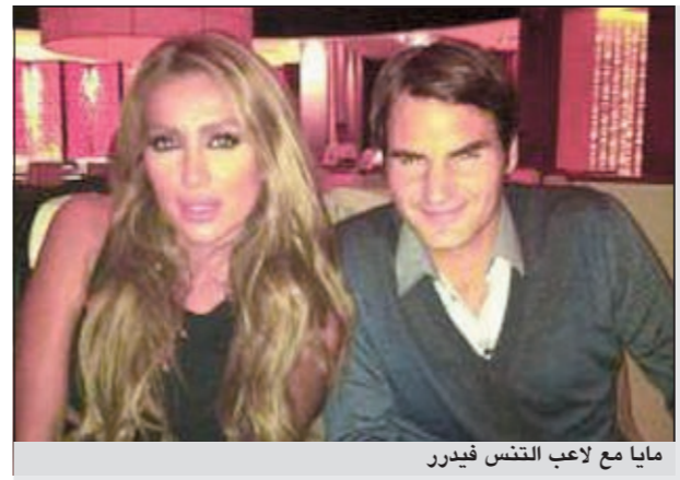
مايا مع لاعب التنس فيدرر

يستعد الممثل أسر ياسين للعودة للدراما مع السوربة كندة علوش لتجسيد دور «البلطجي» في مسلسل يحمل الاسم نفسه. وسيبدأ أسر التصوير أول فبراير بعد انتهاء السيناريست أسامة نور الدين من كتابة المسلسل. وتدور القصة، حسب ما ذكر موقع «الفن أونلاين» حول استمرار الفوضى في