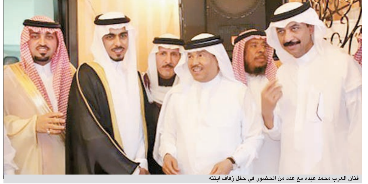
فنان العرب محمد عبده مع عدد من الحضور في حفل زفاف ابنته

كلمات الثناء والمدح، قائلاً: «والله يا عمي أنت مفخرة للسعوديين وليس لي فقط، وأنا لي الشرف بزواجي من ابنتك وأن تكون جد أولادي.. أنا اعتبر نفسي محظوظاً جداً بأن وفقني الله واختار لي ابنتك «ود» زوجة، وإن شاء الله تكون خير زوجة وخير أم، كما هي خير ابنة لخير إنسان وفنان».