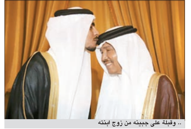
.. وقبله على جبينه من زوج ابنته

أقام فنان العرب محمد عبده حفل عقد قران ابنته «ود» بأحد فنادق مدينة جدة في أمسية فنية حضرها نخبة من فنانتي السعودية، وتواجد محمد عبده منذ ساعة مبكرة في الحفل لاستقبال الحضور. وعبر محمد عبده عن سعادته البالغة لعقد قران ابنته لمجلة سيدتي، وقال، حسب موقع