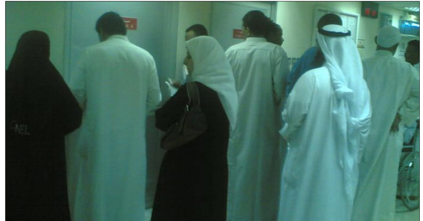
الوضع الصحي في الكويت يحتاج إلى جهود كبيرة لإخراجه من حالة الركود